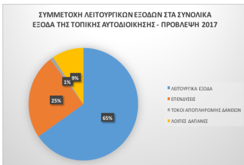
ΔΙΑΓΡΑΜΜΑ 2.3. Συμμετοχή Λειτουργικών Εξόδων στα συνολικά έξοδα της Τοπικής Αυτοδιοίκησης