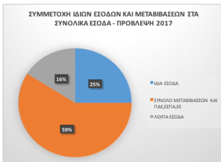
ΔΙΑΓΡΑΜΜΑ 2.1 Συμμετοχή Ιδίων Εσόδων και Μεταβιβάσεων στο Σύνολο των Εσόδων

Ο μεγάλος βαθμός εξάρτησης της ελληνικής Τοπικής Αυτοδιοίκησης από τις κρατικές χρηματοδοτήσεις, φαίνεται και από την έρευνα που δημοσιοποίησε ο Οργανισμός Οικονομικής Συνεργασίας και Ανάπτυξης και η Ένωση Πόλεων και Τοπικής Αυτοδιοίκησης, με την υποστήριξη της Γαλλικής Αναπτυξιακής Εταιρείας τον Οκτώβριο 2016, με θέμα τη διάρθρωση, τις αρμοδιότητες και τα οικονομικά της Τοπικής Αυτοδιοίκησης σε παγκόσμιο επίπεδο. 21 Η αναλυτική παρουσίαση των αποτελεσμάτων της μελέτης αυτής 22 , σε σχέση με