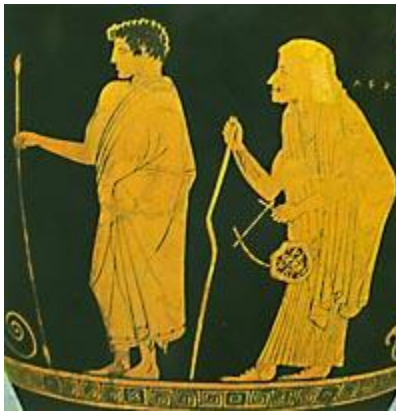
Εικόνα 1 : « Ο παιδαγωγός συνοδεύει το παιδί στο χώρο διδασκαλίας»

εργασία τους επί πληρωμή τους υποβίβαζε κοινωνικά. Τα παιδιά τα συνόδευαν ιδιωτικοί δούλοι, οι λεγόμενοι παιδαγωγοί , στους τόπους διδασκαλίας οι οποίοι πολλές φορές κουβαλούσαν και τα σχολικά τους είδη και έμεναν εκεί ώσπου να τελειώσουν τα μαθήματα ώστε να τα οδηγήσουν πίσω στο σπίτι.. Αυτοί συμπληρώνοντας την πρώιμη εκπαίδευσή των παιδιών όφειλαν να τους μάθουν να βαδίζουν με ευπρέπεια, να κοιτάζουν χαμηλά, να είναι σιωπηλοί, να δίνουν τη θέση τους στους μεγάλους, να μη γελούν τρανταχτά, να μην ακουμπούν το χέρι τους στο σαγόνι, να μην τρώνε λαίμαργα, ούτε να ζητούν τίποτε την ώρα του γεύματος. Ακόμη, έργο τους ήταν να παρακολουθούν την πρόοδο του μαθητή και να ενημερώνουν τον πατέρα αν ο δάσκαλος ήταν καλός ή όχι και μάλιστα ήταν παρόντες στην ώρα του μαθήματος βοηθώντας έτσι και το παιδί να επαναλάβει τα μαθήματά του και στο σπίτι.. Επίσης, ήταν εξουσιοδοτημένοι να υποβάλλουν βία όποτε χρειαζόταν γι' αυτό και χαρακτηρίζονταν ως «τρομεροί» και «τυραννούντες». 20 Ο νόμος προστάτευε με αυστηρότητα τους τόπους διδασκαλίας κυρίως από απόπειρες αποπλάνησης των παιδιών από ενήλικους, αλλά δεν είχε καθιερώσει κάποιο εκπαιδευτικό πρόγραμμα και έτσι ο κάθε δάσκαλος αυτοσχεδίαζε τη διδασκαλία του.