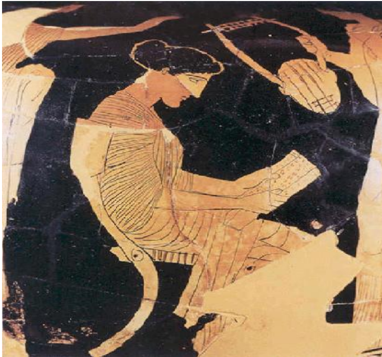
Εικόνα 7: « Η Σαπφώ διδάσκει ποίηση στις μαθήτριάς της»

«φιλίας». 41 Οι αρχαίοι έλληνες μάλιστα σύγκριναν τη Σαπφώ με το Σωκράτη και θεωρούσαν αυτή τη σχέση παρόμοια με τους δεσμούς που είχε ο φιλόσοφος με τους δικούς του μαθητές. Ήταν όμως ένας έρωτας που διεγειρόταν από τη θέα του σωματικού κάλλους, αλλά εξιδανικευόταν ως ύψιστη πνευματικότητα που μόνο ένας ποιητής μπορούσε να πετύχει και ως το βαθύτερο συναίσθημα, που μόνο μια γυναίκα μπορούσε να αισθανθεί. 42 Στα ποιήματά της ύμνησε το γάμο, την απρόσιτη ομορφιά της συζύγου και τον έρωτα και αποτελεί την πρώτη ποιήτρια παγκόσμιας λογοτεχνίας.