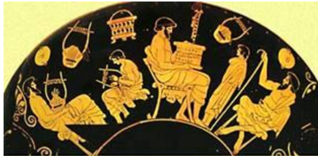
Εικόνα 2: «Ερυθρόμορφο αγγείο 5ου αιώνα π.Χ που απεικονίζει μαθητές να διαβάζουν και να παίζουν λύρα»

Σε αυτούς αργότερα προστέθηκε και ένας τέταρτος δάσκαλος, ο οποίος δίδασκε τη ζωγραφική-δηλαδή την ιχνογραφία, ένα σχέδιο με κάρβουνο πάνω σε λείες σανίδες- με σκοπό την καλλιέργεια του καλής αισθητικής των παιδιών.