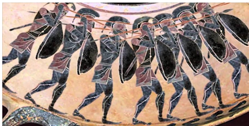
Εικόνα 5: «Αρχαίοι Έλληνες οπλίτες»

Οι έφηβοι λοιπόν ήταν υποχρεωμένοι να συχνάζουν στα γυμνάσια, που πήραν το όνομα τους από τους ίδιους τους νέους οι οποίοι αθλούνταν γυμνοί. Εκεί ασκούσαν στο τρέξιμο, στον χειρισμό των όπλων και στην πορεία υπό τον ήχο του αυλού με σκοπό να αντέχουν, να έχουν καλό παράστημα και να πειθαρχούν, έτσι προετοιμάζονταν για τον πόλεμο αλλά και για αθλητικούς αγώνες τοπικούς ή πανελλήνιους. Επιπλέον, τα γυμνάσια ήταν τόποι εκπαίδευσης των στρατιωτών και της οπλιτικής φάλαγγας και αποσκοπούσαν στην ευκινησία των νεαρών οπλιτών. Αργότερα, με την εμφάνιση των φιλοσόφων τα γυμνάσια γίνονται χώροι πνευματικής εκπαίδευσης. Αρχικά η εφηβική θητεία ήταν εποχική και οι έφηβοι έμεναν στο σπίτι τους, εκτός από τις περιόδους που υπηρετούσαν ως μέλη περιπόλων ή φύλακες στα συνοριακά φρούρια. Αναλάμβαναν δηλαδή την υπεράσπιση και την επιτήρηση των συνόρων και σε εξαιρετικές περιπτώσεις αποστέλλονταν σε εκστρατείες έχοντας ελαφρύ οπλισμό μια και δεν ήταν ακόμα οπλίτες. Αργότερα ο θεσμός της εφηβείας μεταρρυθμίστηκε και κρατούσε δύο χρόνια από τα δεκαοχτώ έως και τη συμπλήρωση των είκοσι και λάμβαναν αποζημίωση.