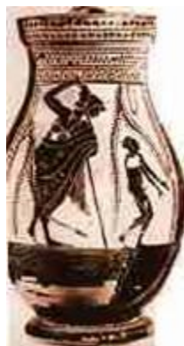
Εικόνα 3: «Αττική οinoχόη που απεικονίζει τιμωρία μικρού μαθητή»

Εν κατακλείδι, οι διδάσκαλοι επέβαλλαν αυστηρή πειθαρχία στους μαθητές και κατέφευγαν σε σωματικές τιμωρίες όποτε χρειαζόταν. Επιπλέον, ανήκαν στη κατηγορία των ελεύθερων αλλά όχι προνομιούχων πολιτών, γι αυτό και προσπαθούσαν να προσελκύσουν περισσότερα παιδιά, ώστε να εισπράττουν όσο το δυνατό περισσότερα δίδακτρα.