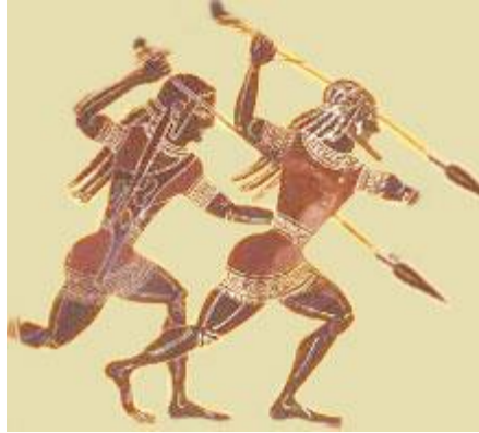
Εικόνα 6: «Η σπαρτιατική αγωγή»

Αναφορικά με την « αγωγή » ως τη βασική εκπαίδευση, αυτή ήταν η μάθηση της υπακοής και της αντοχής και της πειθαρχίας στην ομαδικότητα με αποτέλεσμα την ανώτερη διάκρισή τους. Τα παιδιά χωρίζονταν σε ομάδες και σε κάθε ομάδα οριζόταν ένας αρχηγός. Τα υπόλοιπα παιδιά έπρεπε να ακολουθούν τις διαταγές των αρχηγών τους και να δέχονται και τις τιμωρίες που τους επέβαλλαν. Η αγωγή έμοιαζε με την καθοδήγηση και εξημέρωση των κοπαδιών, δηλαδή οι βασικές μονάδες αποτελούνταν από τις βούες (κοπάδια βοδιών), πολλές βούες αποτελούσαν μια αγέλη και πολλές αγέλες μια ίλα (ένα στρατιωτικό τμήμα). Ένας ειδικός αξιωματούχος ο παιδονόμος με τα μαστιγοφόρα έλεγχε τις ομάδες στους τρεις αυτούς κύκλους της αγωγής. Στόχος αυτής της διαδικασίας ήταν η απόκτηση της αυτάρκειας, της γνωριμίας με τον εαυτό τους και της αντοχής στη πείνα, στη δίψα, στη ζέστη και στο κρύο. Επιπλέον στόχευε στο ζήλο, την άμιλλα και την επιθυμία της ανωτερότητας. Οι πιο έξυπνοι και παθιασμένοι για μάχη γίνονταν αρχηγοί της ομάδας και οι γέροντες επέβλεπαν το παιχνίδι και προξενούσαν πολλές φορές καυγάδες ώστε να ξεχωρίσουν τους πιο τολμηρούς και μαχητικούς.