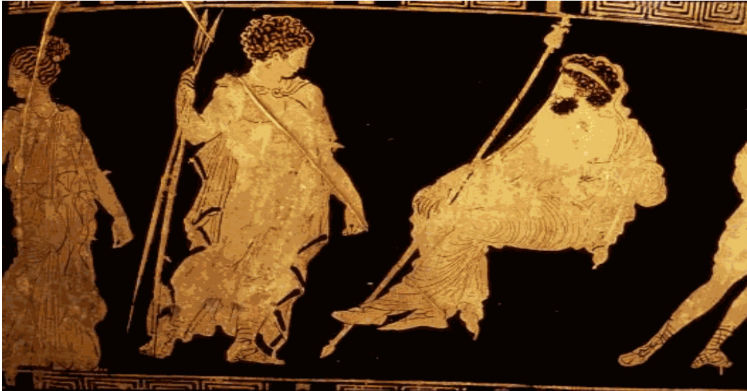
Εικόνα 8: « Σοφοκλέους Φιλοκτήτης»

Ο Σοφοκλής στις τραγωδίες του εστιάζει κυρίως στην αντίδραση του ανθρώπου απέναντι στη δυστυχία και αντιπαρατάσσει μια πεισματική και αμείλικτη σταθερότητα έως στην αυτοκαταστροφή, απορρίπτοντας κάθε συμβιβασμό με αποτέλεσμα ο ήρωας να οδηγείται στην απόλυτη μοναξιά. Με τον Σοφοκλή, το πρόβλημα της ανθρώπινης γνώσης φτάνει στο αποκορύφωμά του, τονίζονται ιδιαίτερα τα ανθρώπινα σφάλματα και στα έργα του παρατηρείται ένα σύμπαν αντιθέσεων ανάμεσα σε πρόσωπα και καταστάσεις. Επιπλέον, ο ποιητής πολεμά την ανθρωποκεντρική αντίληψη του κόσμου (όπως την εισηγείται ο Αναξαγόρας) και τον σχετικισμό της εκπαίδευσης των σοφιστών, γι' αυτό και η απόρριψη της σοφιστικής είναι ιδιαίτερα έντονη στα έργα του, ιδίως στο τραγικό έργο «Φιλοκτήτης» που θα αναλυθεί σε αυτό το κεφάλαιο. Είναι φανερό λοιπόν, πως ηθικές αξίες και κοινωνικές, πολιτικές και πολιτισμικές θεωρίες και καταστάσεις της εποχής του αντικατοπτρίζονται στα έργα του.