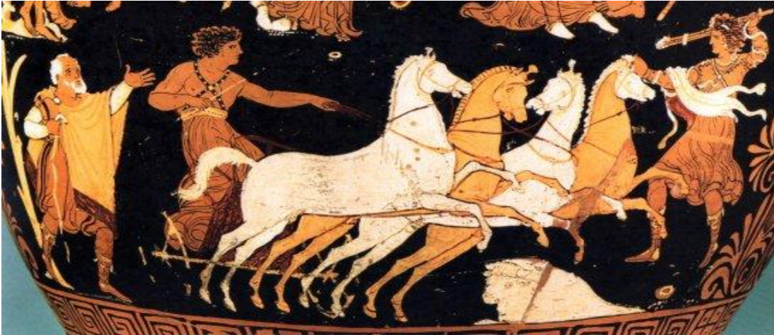
Εικόνα 9: «Ευριπίδου Ιππόλυτος»

Ο Ευριπίδης προσεγγίζει στο έργο του τα πολιτιστικά προβλήματα της εποχής του και χαρακτηρίζεται από την απομυθοποίηση των παραδοσιακών αξιών, ενώ παράλληλα προσαρμόζεται στον κοινό άνθρωπο και εκφράζει τα προβλήματα και την διαμαρτυρία ευρύτερων κοινωνικών ομάδων. Στη σκηνή παρουσιάζει όλα τα λάθη του ανθρώπου και τις αντιφάσεις του και ανυψώνει περιθωριοποιημένους χαρακτήρες, οι οποίοι αναζητούν μάταια τη νομοτελειακή τάξη και προσπαθούν να βρουν μια άγκυρα σωτηρίας σε κάποιον όμοιό τους. Θεωρείται μαθητής του Αναξαγόρα από τον οποίο έχει επηρεαστεί σε μεγάλο βαθμό και συσχετίζεται επίσης και με τους σοφιστές. Οι επιδράσεις από τη διδασκαλία του Αναξαγόρα, τις γλωσσικές απόψεις του Πρόδικου και του Πρωταγόρα είναι εμφανείς στο έργο του ποιητή. Πρότυπά του είναι η τάξη και η σωφροσύνη στη πολιτική ζωή, ενώ καταφέρεται με σφοδρότητα εναντίον των δημαγωγών οι οποίοι παρασύρουν το πλήθος στην καταστροφή και κατακρίνει την αλαζονεία τους.