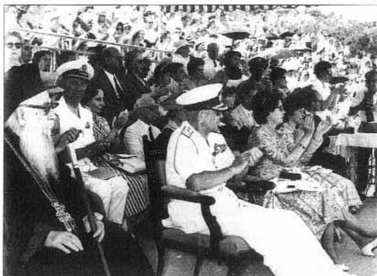
Ο βασιλιάς Παύλος, η βασίλισσα Φρειδερίκη και η πριγκίπισσα Ειρήνη παρακολουθούν τις γυμναστικές επιδείξεις τον Ιούνιο του 1958. Αριστερά ο μητροπολίτης Ύδρας, Σπεισιών και Αγίνης Προκόπιος (Κοραμάνος) και στη δεύτερη σειρά (με τα γαλιά) ο δήμαρχος Σπενταών Περικλής Μιούμουλης.