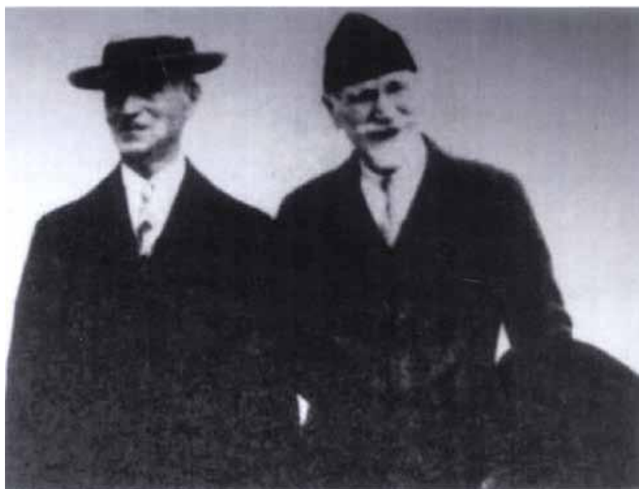
Ο Σωτήριος Ανάργυρος με τον Ελ. Βενιζέλο