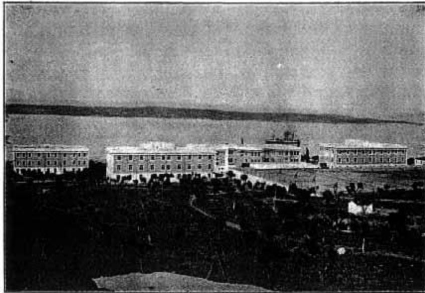
Γενική ἄποψις τῆς Σχολῆς ἀπὸ ξηρᾶς.