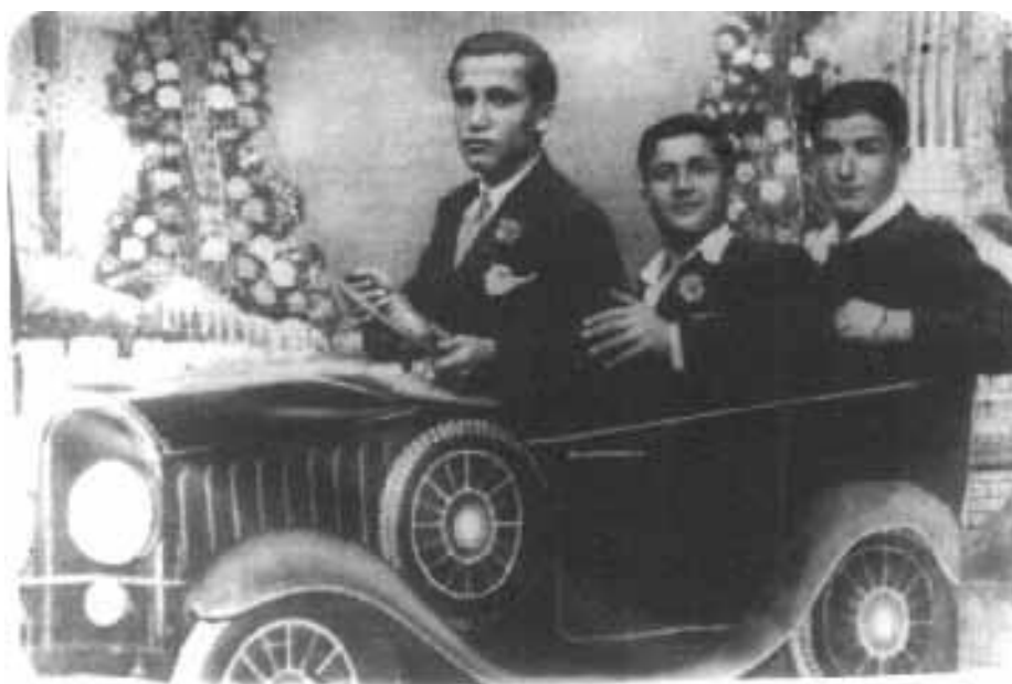
Ο Βασιλιάς Αλέξανδρος