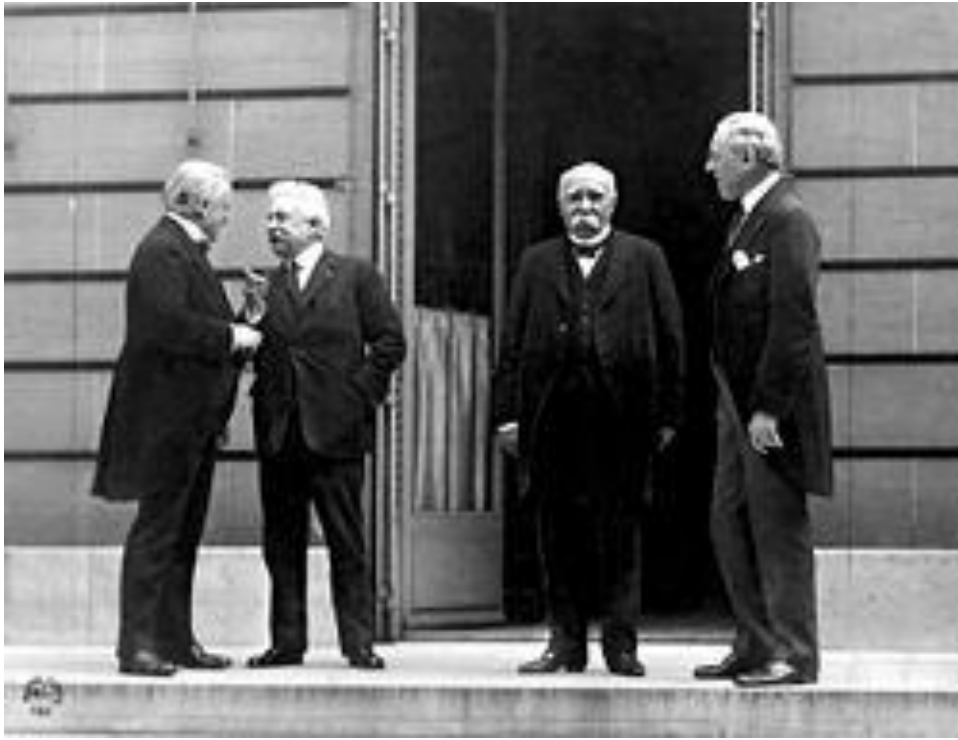
Το Συμβούλιο των Τεσσάρων στη Σύνοδο Ειρήνης των Παρισίων: Λόντ Τζώρτζ, Βιτόριο Ορλάντο, Ζωρζ Κλεμανσώ και Γούντροου Ουίλσον