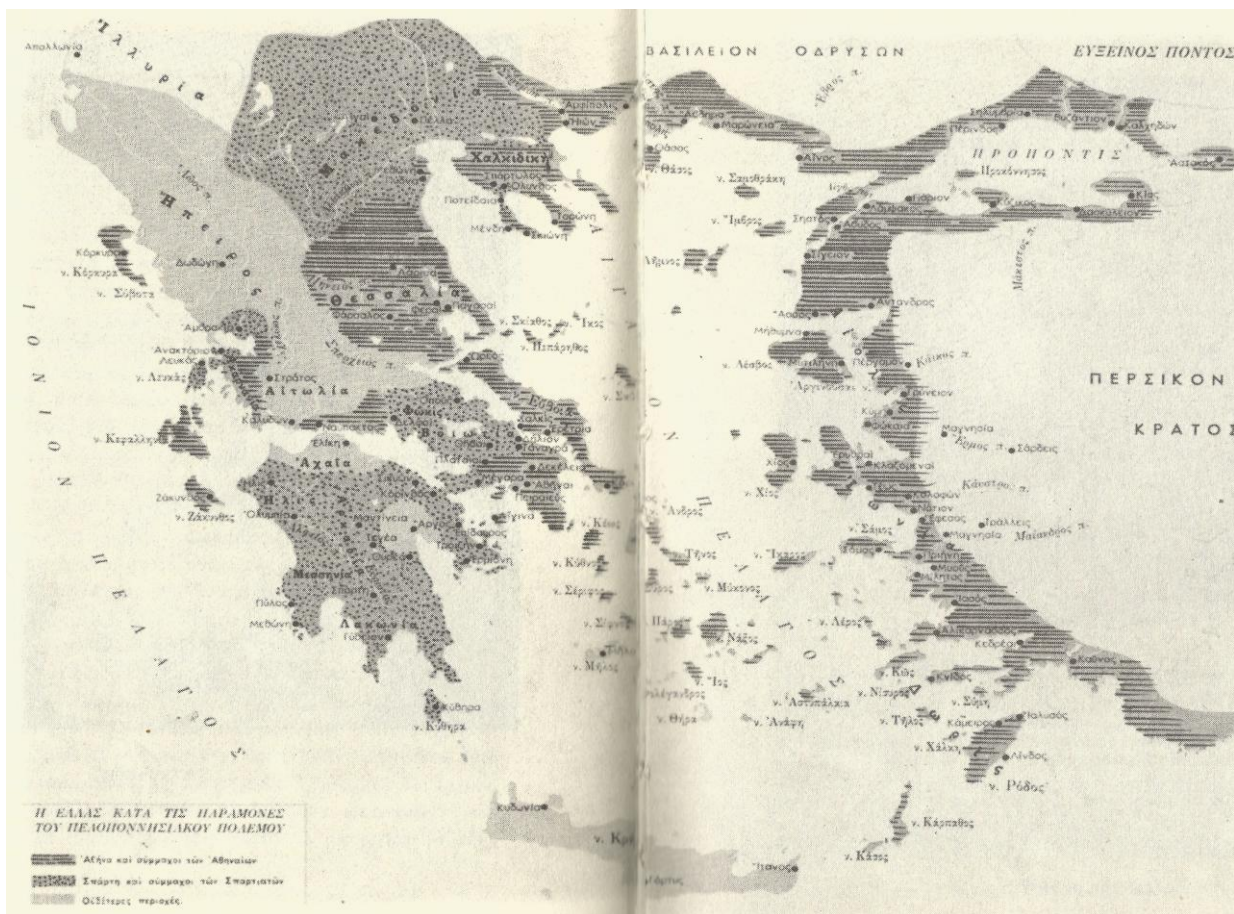
Σύμμαχοι Αθηναίων και Σπαρτιατῶν