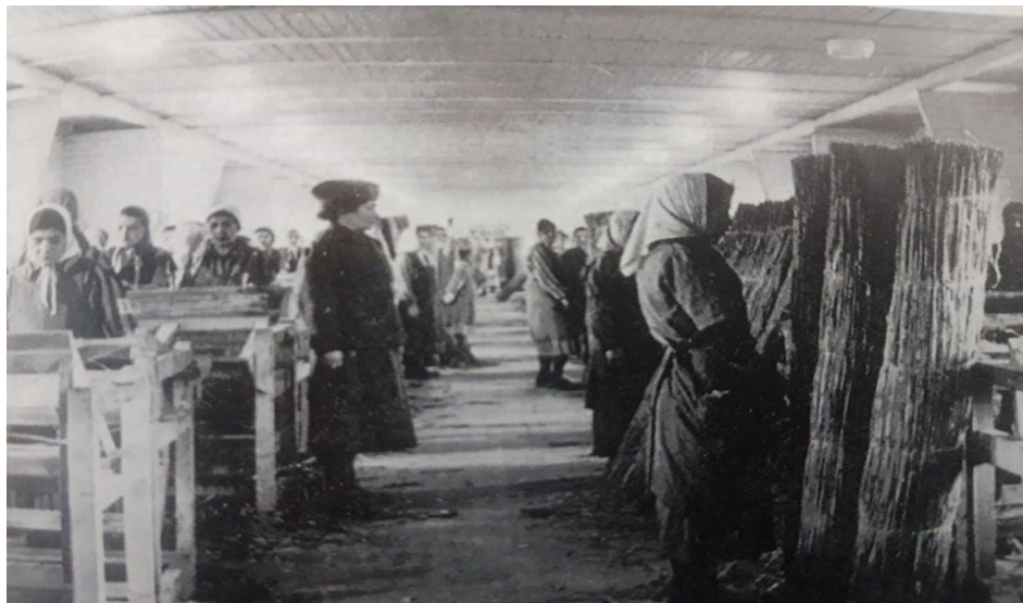
Εικόνα 4. Πλεκτήριο για ψάθες στο στρατόπεδο συγκέντρωσης Ράβενσμπρικ. Φωτογραφία που τραβήχτηκε από τα Ες Ες για προπαγανδιστικούς λόγους. Ίδρυμα του Ράβενσμπρικ στη μνήμη των θυμάτων. (Πηγή: Fings K. - Heuss H. – Sparing F., Οι Σίντι και οι Ρομά υπό το ναζιστικό καθεστώς, Αθήνα 1998)