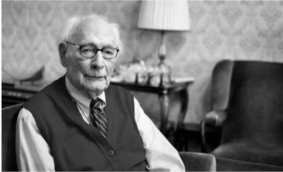
Εικόνα 9. Ο δάσκαλος, Johan van Hulst , έσωσε εκατοντάδες εβραιόπουλα