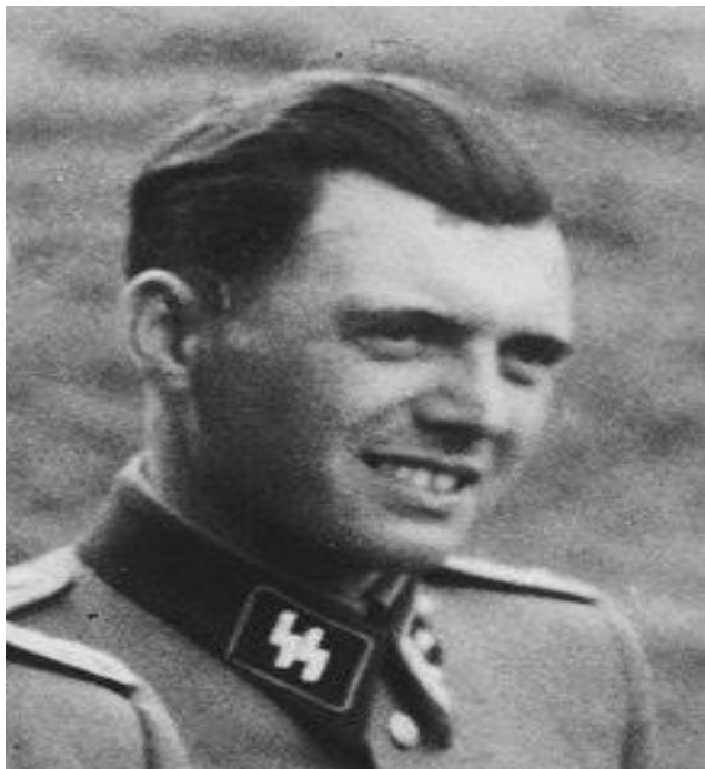
Εικόνα 12. Γιόζεφ Μένγκελε Ο επονομαζόμενος «Άγγελος του Θανάτου», ο ανώτατος γιατρός του Λουσβιτς που αποφάσιζε το ποιος θα πεθάνει αμέσως και ποιος θα χρησιμοποιηθεί ως εργάτης ή ως πειραματόζωο.