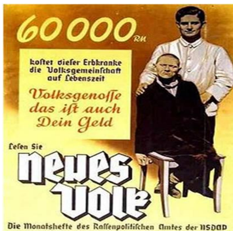
Εικόνα 6. Η αφίσα λέει πως ένας ανάπηρος κοστίζει 60.000 μάρκα. «Σύντροφε, αυτά είναι και δικά Σου χρήματα» «Νέος λαός» - Έκδοση του Γραφείου Φυλετικής Πολιτικής του NSDAP -Εθνικοσοσιαλιστικού Κόμματος»