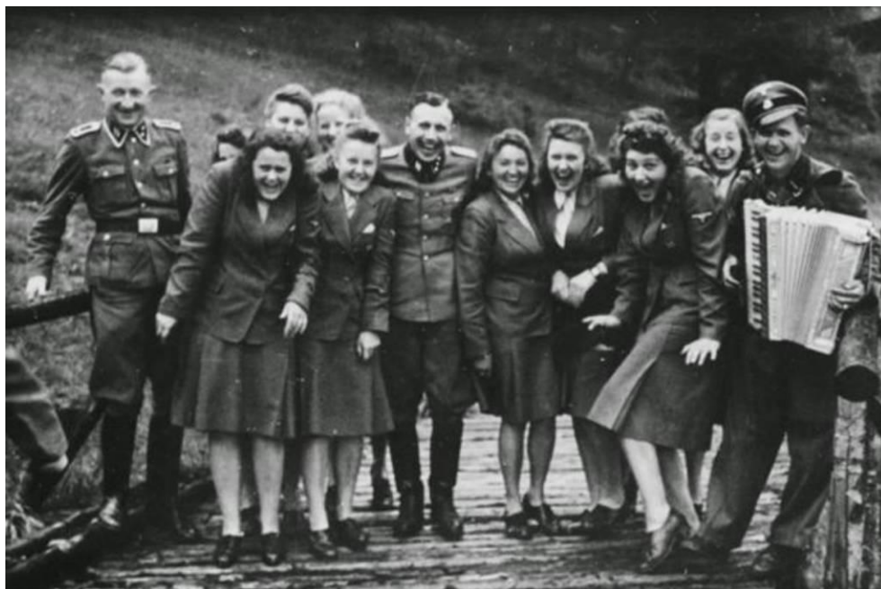
Εικόνα 13. Το λιγότερο αποτροπιασμό προκαλούν οι φωτογραφίες ντοκουμέντα που απεικονίζουν τους φρουρούς του στρατοπέδου θανάτου Άουσβιτς, σε χαλαρές στιγμές να απολαμβάνουν τη ζωή, ενώ δίπλα τους τα κρεματόρια «δουλεύουν» ακατάπαυστα.