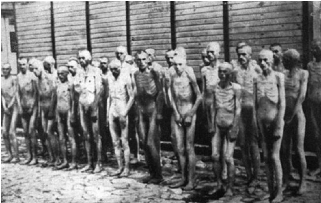
Εικόνα 2. Αιχμάλωτοι σε στρατόπεδο συγκέντρωσης