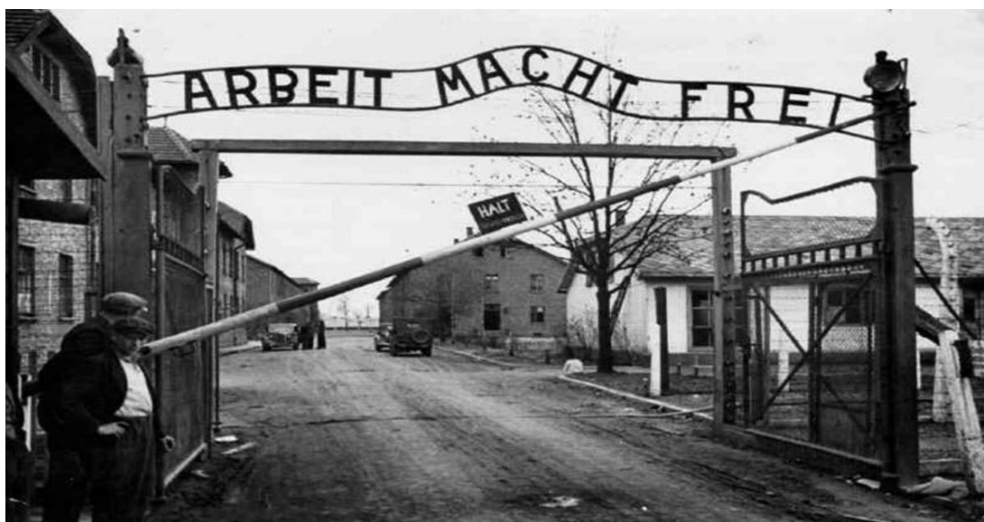
Εικόνα 14. Η πύλη του κυρίως στρατοπέδου του Άουσβιτς, με την επιγραφή «Η εργασία απελευθερώνει».