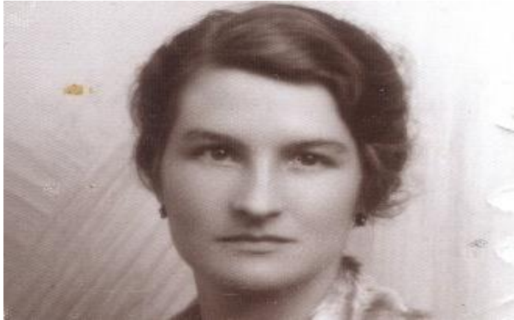
Εικόνα 11. Η Virginia Hall ήταν μια από τις πιο επικίνδυνες κατασκόπους του Β' Παγκοσμίου Πολέμου.