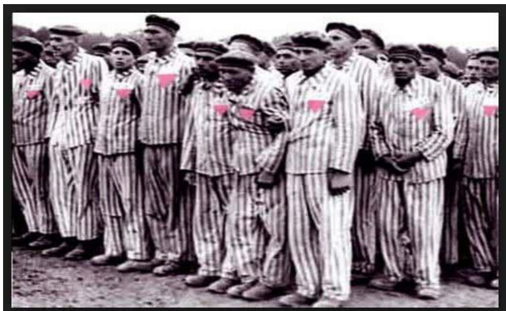
Εικόνα 5. Ομοφυλόφιλοι κρατούμενοι, φορώντας το ροζ τρίγωνο.