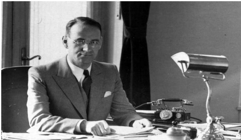
Εικόνα 8. Ο Carl Lutz, ο Ελβετός διπλωμάτης που έσωσε 62.000 Εβραίους.