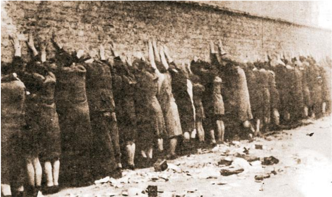
Εικόνα 1. Αδύναμοι άνδρες και γυναικόπαιδα, δευτερόλεπτα πριν τον τουφεκισμό, ( Πηγή: Γιαννακόπουλος Π., «Χάιντς Κούνιο: «Μέσα στα σαπούνια ήταν κάποιος δικός μας»,31/10/2015, διαθέσιμο στο: http://www.athj.com , ημερομηνία προσπέλασης: 12/09/2019)