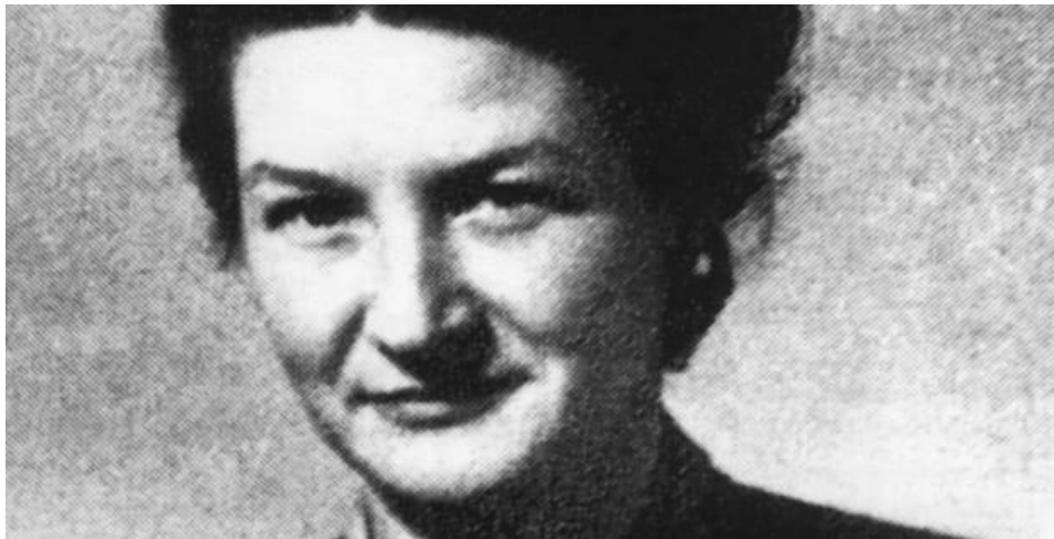
Εικόνα 10. Η Freddie Oversteegen : σκότωνε Ναζί μαζί με την αδελφή της.