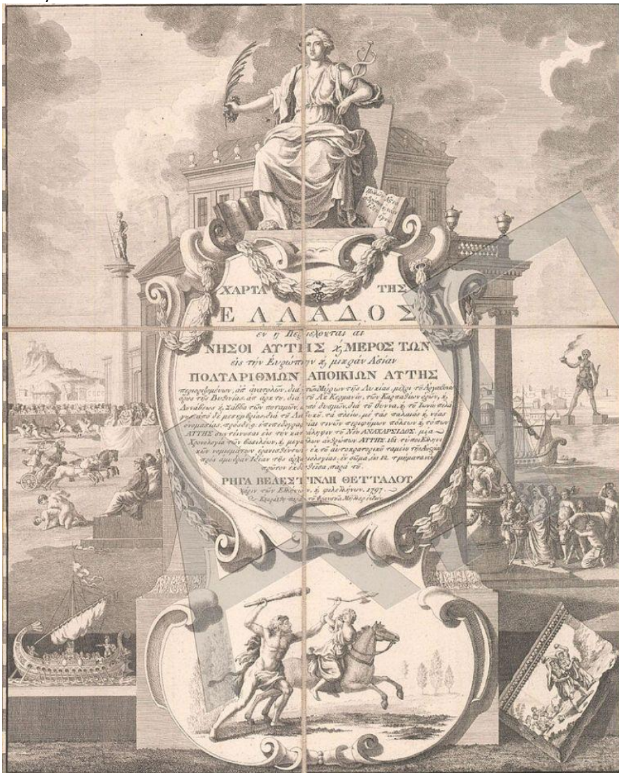
Ο τίτλος της «Χάρτας της Ελλάδος» του Ρήγα, από το 4ο φύλλο, εκδοθείσα το 1797, από αντίτυπο της Βιβλιοθήκης του Αριστοτελείου Πανεπιστημίου Θεσσαλονίκης)