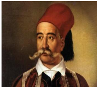
Πετρόμπεης Μαυρομιχάλης (1765-1848),