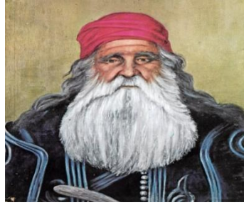
Ο Μητροπέτροβας (1745-1838)