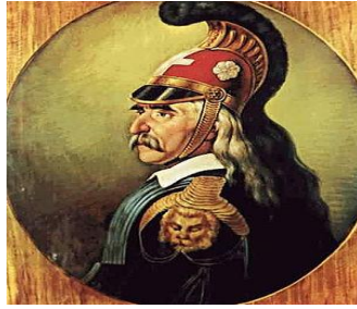
Θεόδωρος Κολοκοτρώνης (1770-1843),