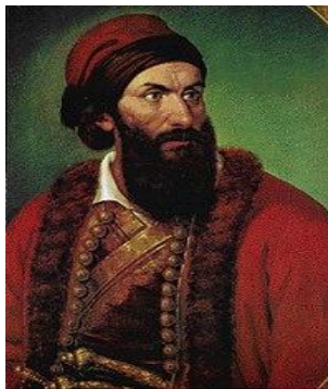
Ο Παπαφλέσσας (1788-1825),