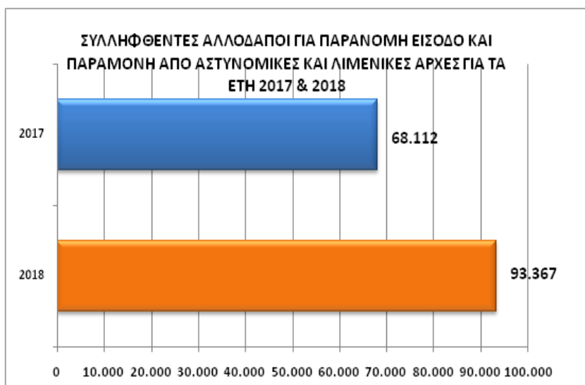
Εικόνα 2 Παράνομη είσοδος και παραμονή 2017-2018 (πηγή: www.astynomia.gr)