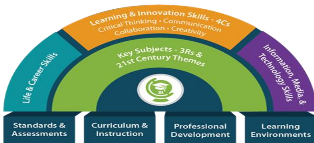
Εικόνα 1. P21, Πλαίσιο δεξιοτήτων 21 ου αιώνα

Παραμένει, ωστόσο, ένα βαθύ κενό μεταξύ των γνώσεων και των δεξιοτήτων που οι περισσότεροι μαθητές μαθαίνουν στο σχολείο και τις γνώσεις και τις δεξιότητες που χρειάζονται στους χώρους εργασίας του 21ου αιώνα. Η εταιρική σχέση για τις δεξιότητες του 21ου αιώνα, αποτελείται από μια ομάδα σημαντικών επιχειρηματικών και εκπαιδευτικών οργανώσεων, που σχηματίστηκαν το 2002 για να εργαστούν κλείνοντας αυτό το κενό. Ο Οργανισμός P21 (2007) έχει προωθήσει τον εθνικό διάλογο στις ΗΠΑ σχετικά με τις δεξιότητες του 21ου αιώνα, ενσωματώνοντάς τις στην διδασκαλία, στην ανάπτυξη των προγραμμάτων σπουδών και στη δημιουργία μαθημάτων που αντικατοπτρίζουν την πραγματικότητα του 21ου αιώνα (P21,2007) .