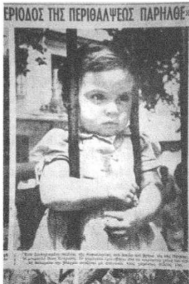
ΕΘΝΟΣ, Τετάρτη 19 Αυγούστου 1953

Πολλοί από τους κατοίκους της είχαν καταφύγει έντρομοί από τας προηγούμενας δονήσεις, εις τόν λόφον "Φαραώ". 'Αλλά έντός της πόλεως εύρίσκαnton χιλιάδες κατοίκων και άλλοι μίν παρέμενον εις τας οικίας των, άλλοι δέ εις τας πλατείας και τους άσκειεις έν γίνει χώρους.