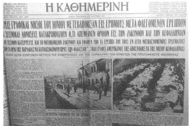
Η ΚΑΘΗΜΕΡΙΝΗ, Παρασκευή 14 Αυγούστου 1953

(ΕΘΝΙΚΟΣ ΚΗΡΥΞ, Πέμπτη 13 Αύγούστου 1953)