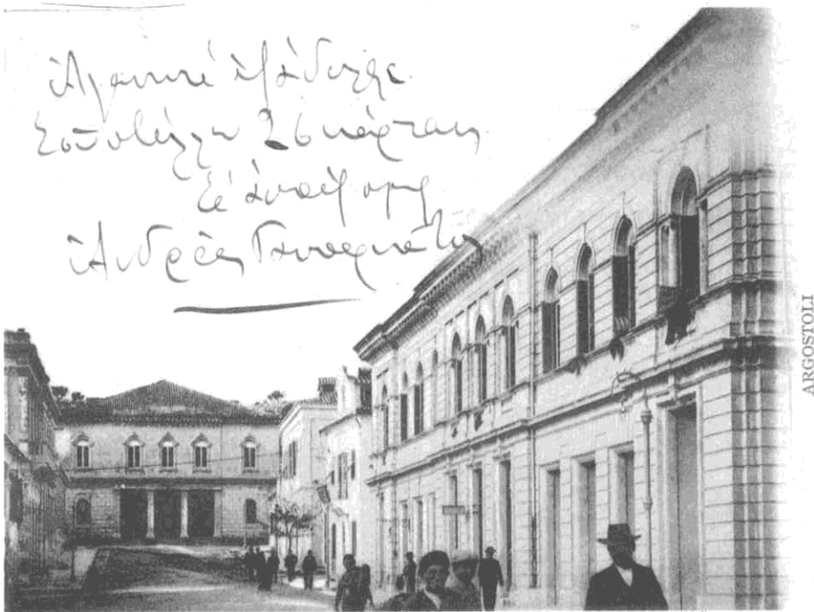
Η Κεφαλονιά πριν τους σεισμούς Η προσεισμική Κεφαλονιά μέσα από καρτ – ποστάλ.