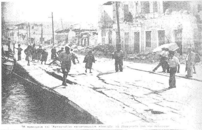
Ἡ κατάσταση τοῦ Ἀργουστολίου καταστραμμένη πληρῶς ὑπό τῆς σεισμικῆς ἐπιπέσεως.

(ΕΘΝΙΚΟΣ ΚΗΡΥΞ, Παρασκευή 14 Αὐγούστου 1953)