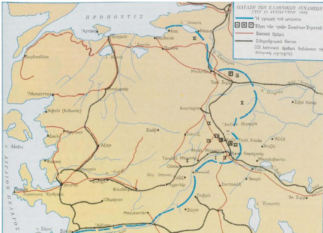
Η γραμμή του ελληνικού μετώπου τον Αύγουστο του 1922