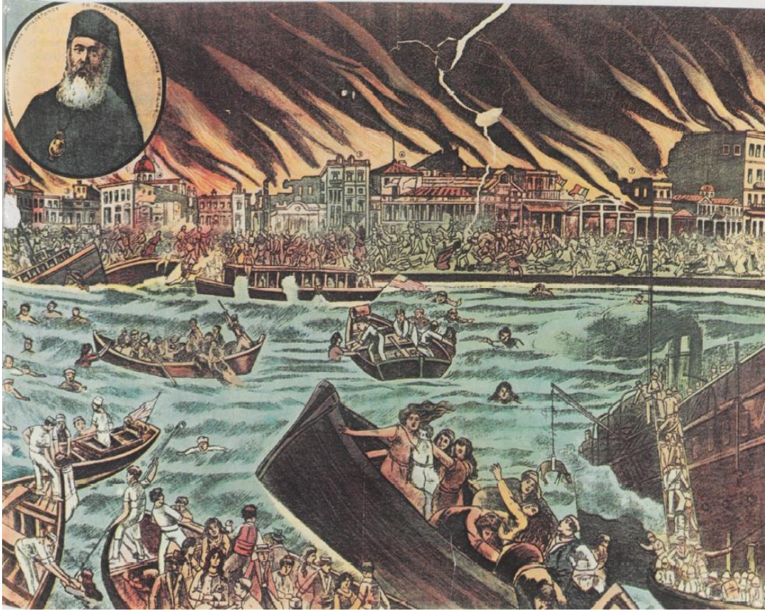
Η καταστροφή της Σμύρνης και ο μαρτυρικός θάνατος του μητροπολίτη Χρυσοστόμου