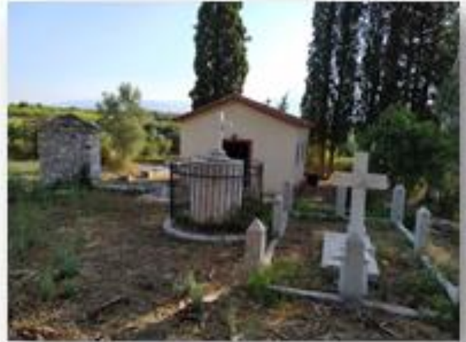
Το εκκλησάκι του Αγίου Αθανασίου και οι οικογενειακοί τάφοι δίπλα στην οικία της οικογένειας Παπατσώνη.