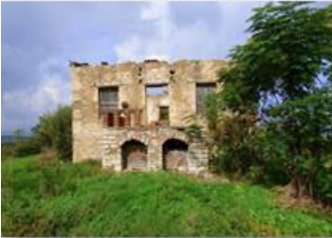
Η παλιά αρχοντική οικία της οικογένειας Παπατσώνη, σήμερα, έξω από την Εύα.