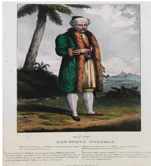
Εικ. 5: Βικιπαίδεια, « Πανούτσος Νοταράς », 10.01.2021, διαθέσιμο στην ιστοσελίδα: https://el.wikipedia.org/wiki/%CE%A0%CE%B1%CE%BD%CE%BF%CF%8D%CF%84%CF%83%CE%BF%CF%82_%CE%9D%CE%BF%CF%84%CE%B1%CF%81%CE%AC%CF%82 , ημερομηνία προσπέλασης 25.08.2021