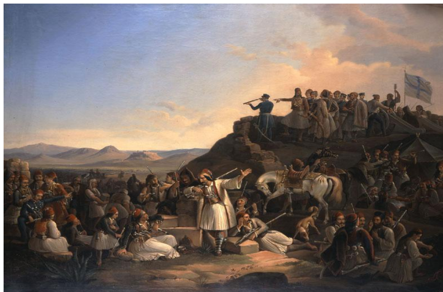
Εικ. 8: Βικιπαίδεια, « Το στρατόπεδο του Καραϊσκάκη στην Καστέλα », 06.05.2017, διαθέσιμο στην ιστοσελίδα:

https://el.wikipedia.org/wiki/%CE%A4%CE%BF_%CF%83%CF%84%CF%81%CE%B1%CF%84%CF%8C%CF%80%CE%B5%CE%B4%CE%BF_%CF%84%CE%BF%CF%85_%CE%9A%CE%B1%CF%81%CE%B1%CF%8A%CF%83%CE%BA%CE%AC%CE%BA%CE%B7_%CF%83%CF%84%CE%B7%CE%BD_%CE%9A%CE%B1%CF%83%CF%84%CE%AD%CE%BB%CE%B1 , ημερομηνία