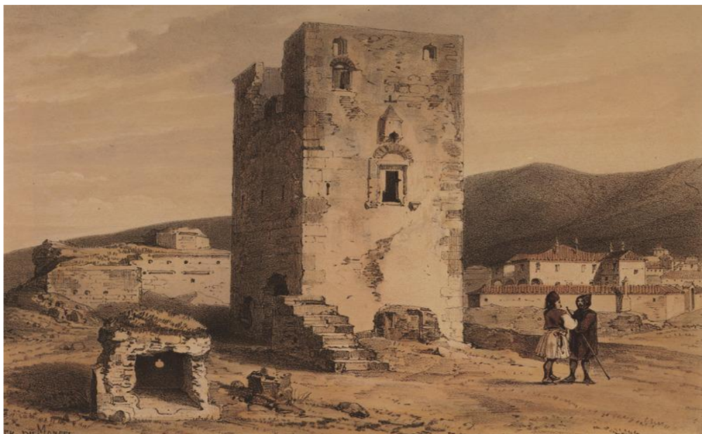
Εικ. 2: Ίδρυμα Αικατερίνης Λασκαρίδη «Μεσαιωνικά ερείπια στην Κόρινθο και τμήμα από το κάστρο του Κιαμήλ - Μπέη», διαθέσιμο στην ιστοσελίδα: https://el.travelogues.gr/item.php?view=41885 , ημερομηνία προσπέλασης 25.08.2021