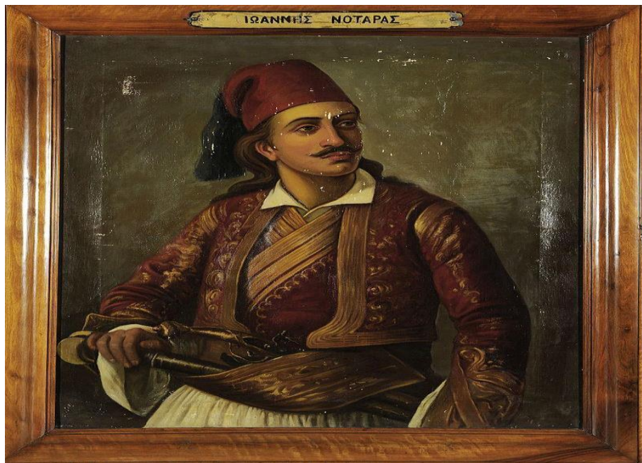
Εικ.4: Βικιπαίδεια, « Ιωάννης Νοταράς », 18.03.2021, διαθέσιμο στην ιστοσελίδα: https://el.wikipedia.org/wiki/%CE%99%CF%89%CE%AC%CE%BD%CE%BD%CE%B7%CF%82_%CE%9D%CE%BF%CF%84%CE%B1%CF%81%CE%AC%CF%82 , ημερομηνία προσπέλασης 25.08.2021