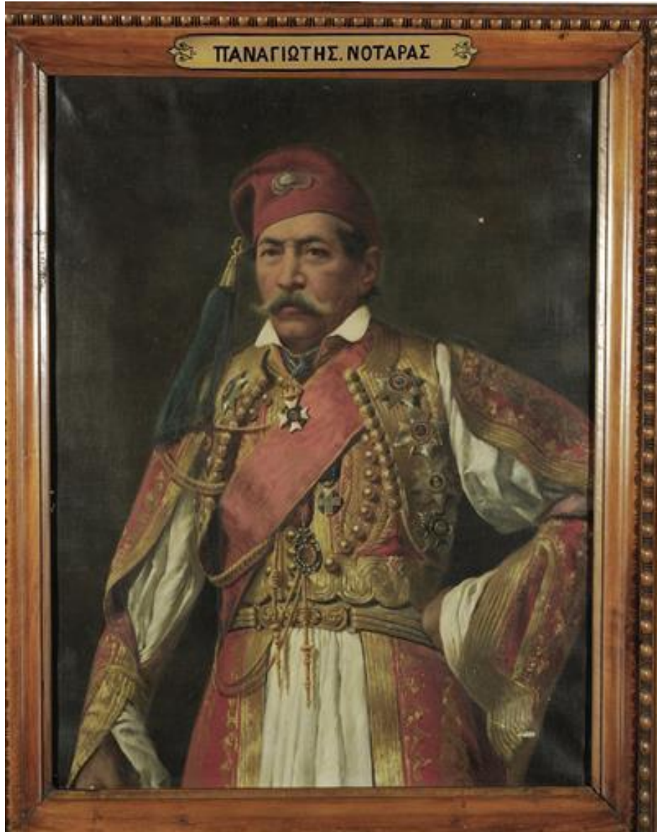
Εικ.6: Εθνικό Ιστορικό Μουσείο «Πορτραίτο του Παναγιώτη Νοταρά», διαθέσιμο στην ιστοσελίδα: https://www.nhmuseum.gr/en/departments/into-the-museum-s-collection/item/5122-portraitofpanagiotisnotarasoilpaintingoncanvas , ημερομηνία προσπέλασης 25.08.2021