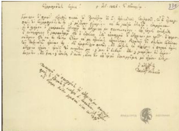
Εικ. 10: Ακαδημία Αθηνών, Ψηφιακό αποθετήριο, «Επιστολή του Πανούτσου Νοταρά προς τον Κωλέττη», διαθέσιμο στην ιστοσελίδα:

http://repository.academyofathens.gr/gr/listItems/191959 , ημερομηνία προσπέλασης 02.09.2021