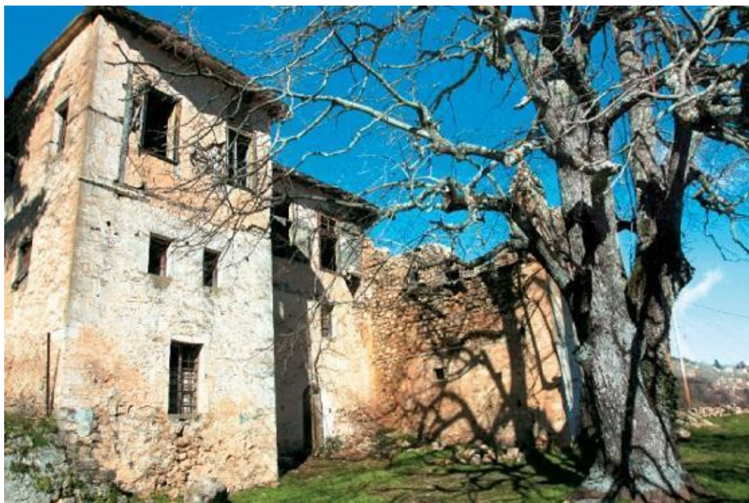
Εικ. 3: Επιμελητήριο Κορινθίας, «Πύργος Νοταρά», διαθέσιμο στην ιστοσελίδα: http://www.visitkorinthia.gr/korinthos/tourism/articles/article.jsp?context=1504&categoryid=11734&articleid=14126 , ημερομηνία προσπέλασης 25.08.2021