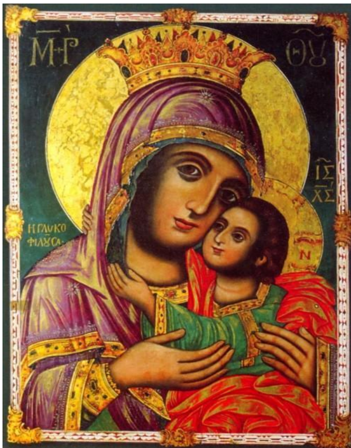
Εικ. 11: Χώρα του Αχωρήτου, «Η εικόνα της Παναγίας Γλυκοφιλούσας του Ιωάννη Καποδίστρια», διαθέσιμο στην ιστοσελίδα: https://choratouaxoritou.gr/?p=109886 , ημερομηνία προσπέλασης 06.09.2021

http://repository.academyofathens.gr/gr/listItems/191959 , ημερομηνία προσπέλασης 02.09.2021