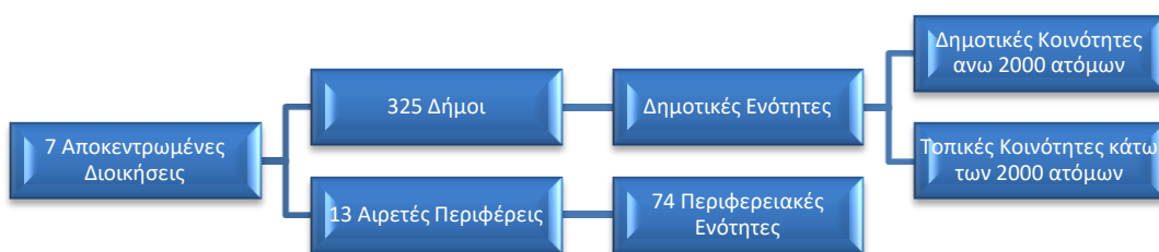
Εικόνα 2: Διοικητική Διάρθρωση των ΟΤΑ επί "Καλλικράτη"