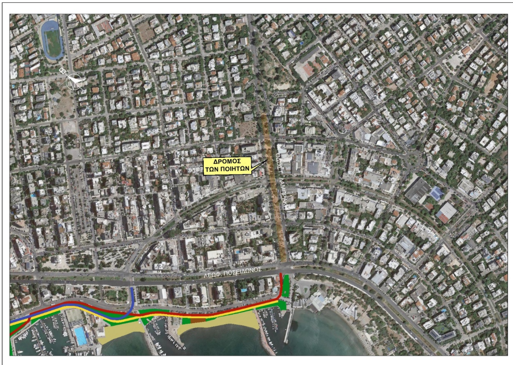
Εικόνα 4: Χάρτης απεικόνισης δρόμου ποιητών