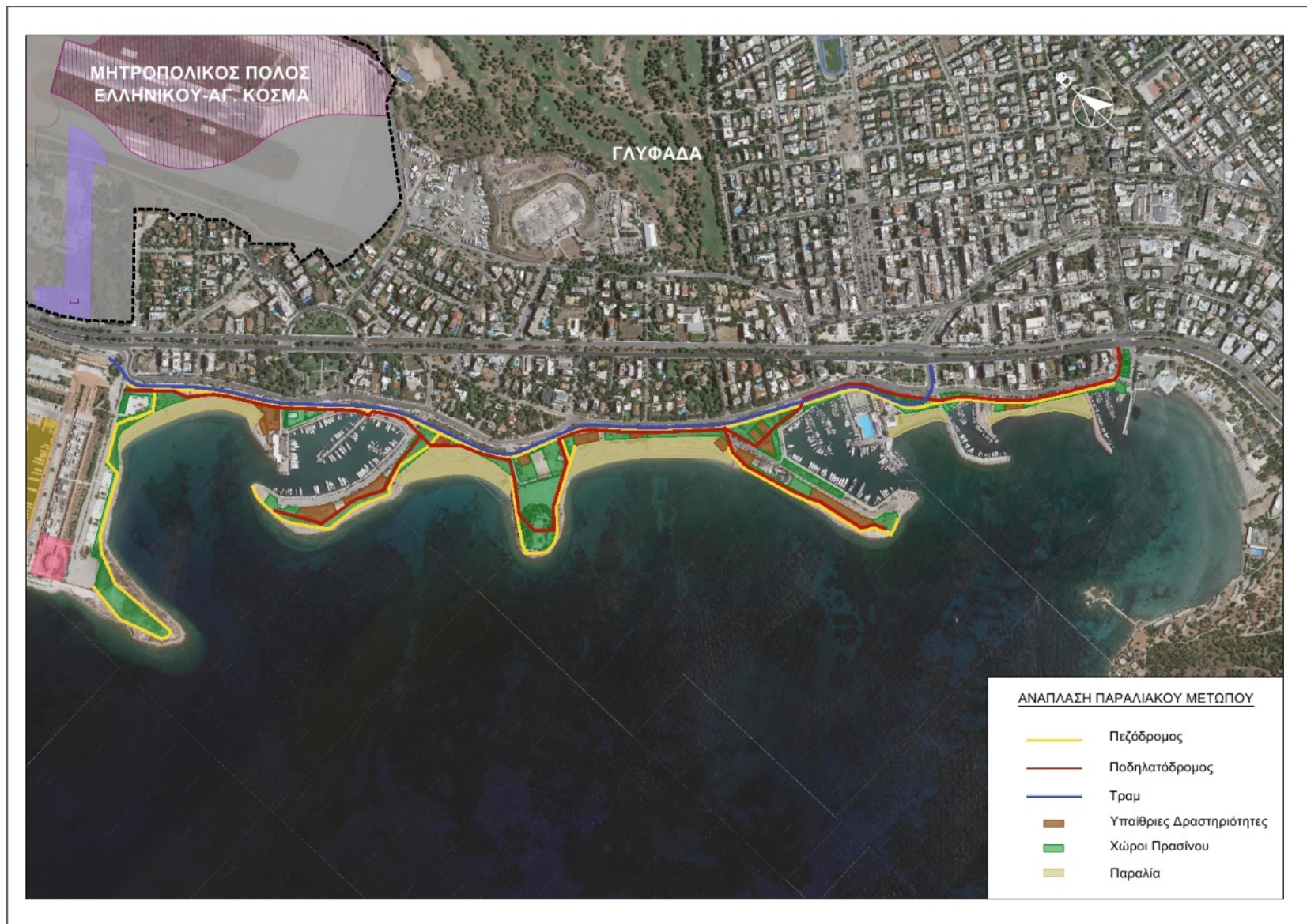
Εικόνα 3:Χάρτης ανάπλασης παραλιακού μετώπου