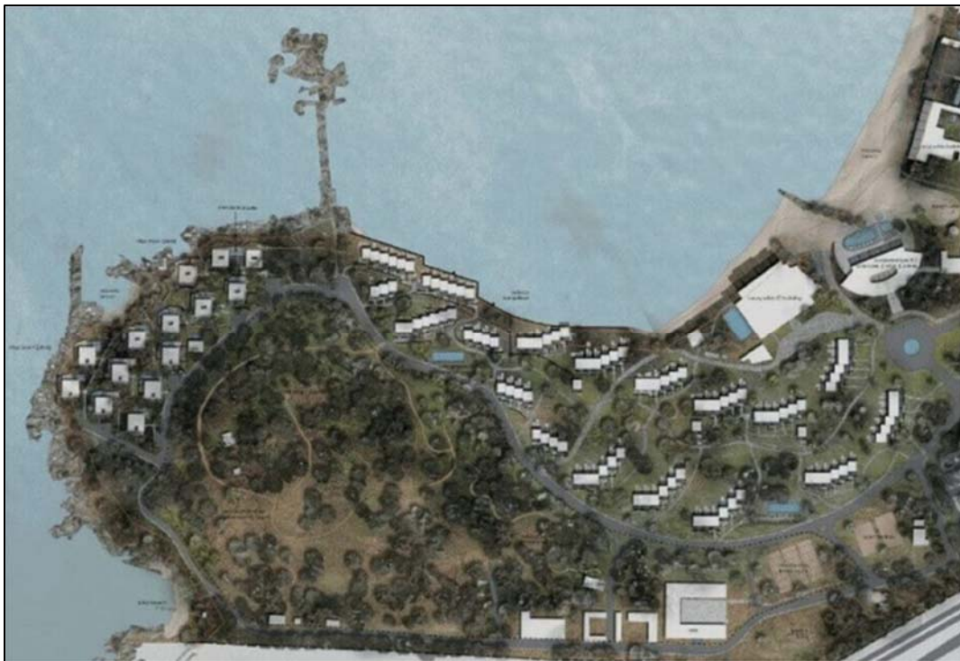
Εικόνα 7: Σχέδια του πολυτελούς ξενοδοχείου One&Only στα Αστέρα Γλυφάδας, Πηγή: https://bizness.gr/