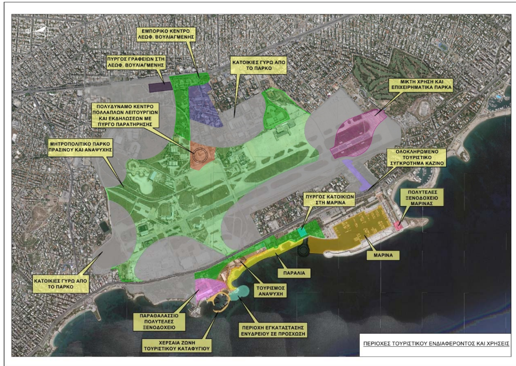
Εικόνα 1: Χάρτης Χρήσεων γης και σημείων ενδιαφέροντος Μητροπολιτικού Πάρκου