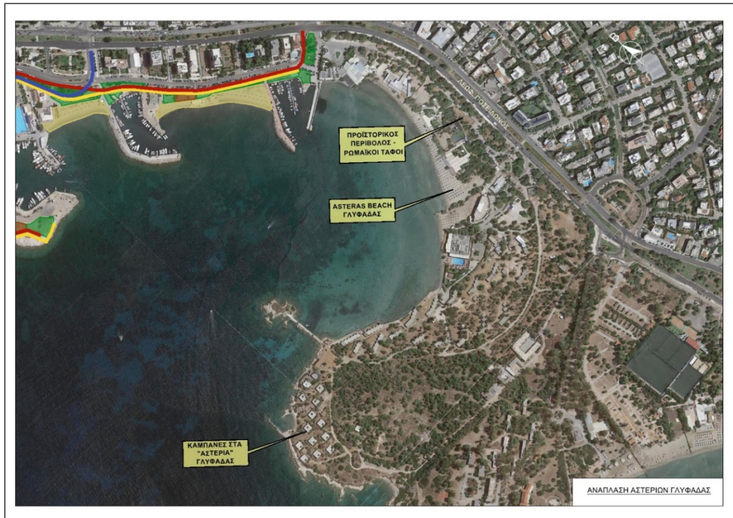
Εικόνα 6: Χάρτης Αστέρας Γλυφάδας