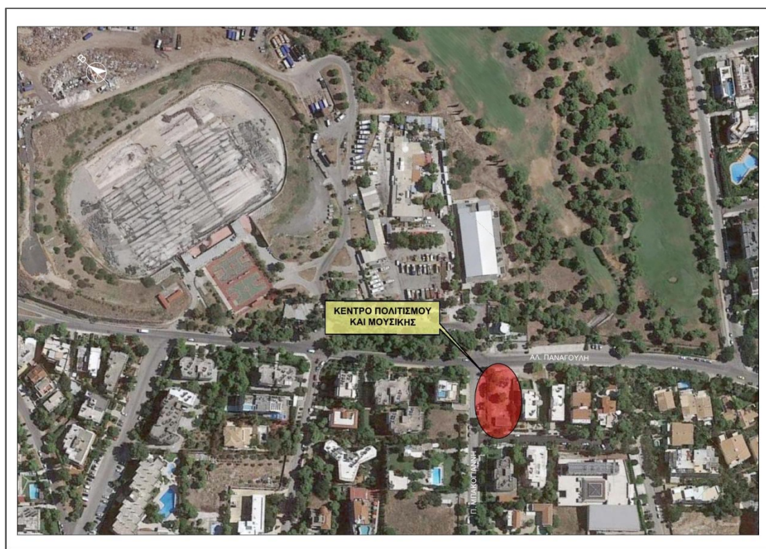
Εικόνα 5: Χάρτης θέσης κέντρου πολιτισμού

Ένα νέο τοπόσημο, μια εστία πολιτισμού που προβλέπεται να δώσει πνοή στην πόλη της Γλυφάδας και θα αλλάξει θεαματικά την εικόνα της είναι το νέο πρότυπο Κέντρο Πολιτισμού και Μουσικής κοντά στο Γκολφ (γωνία Παναγούλη και Μπακογιάννη), το οποίο μαζί με την ανάπλαση της παραλίας εντάσσεται στο πρόγραμμα «Αντώνης Τρίτσης». Η χρηματοδότηση του έργου θα είναι 3.100.000 ευρώ και η ανέγερση του κτιρίου που θα περιλαμβάνει χώρους συναυλιών, δημοτικό ωδείο κ.α. προβλέπεται να γίνει σε οικόπεδο το οποίο έχει κληροδοτηθεί προς το Δήμο από το 1965 μένοντας για χρόνια αναξιοποίητο (ΚΕΔΕ, 2021)