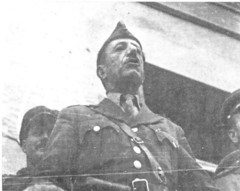
Ο Σαράφης σε λόγο του το 1944