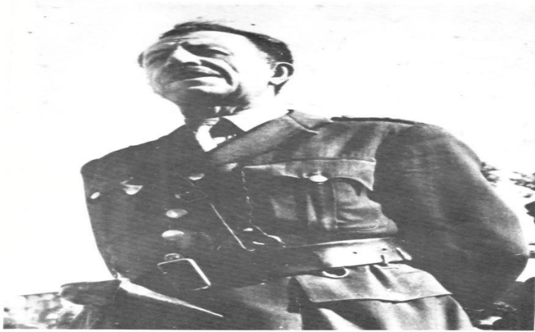
Ο αρχηγός του ΕΛΑΣ στρατηγός Στέφανος Σαράφης (Οκτώβριος 1944)