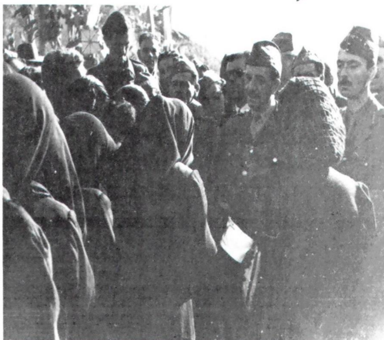
Ο Σαράφης συζητά με γυναίκες του λαού, θύματα της φασιστικής θηριωδίας.