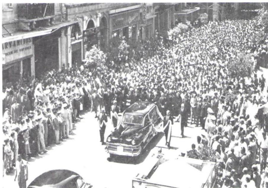
Την ώρα της κηδείας του Στρατηγού. Το πλήθος ανεβαίνει την Μητροπόλεως.