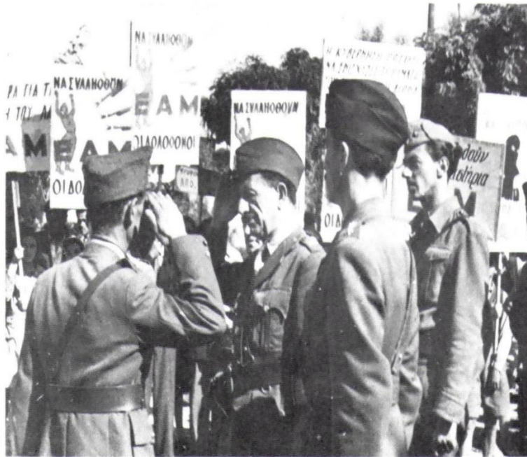
Στιγμές από την απελευθέρωση. Ο Στρατηγός Σαράφης παίρνει αναφορά από επικεφαλής τμήματος του ΕΛΑΣ Αθήνας.