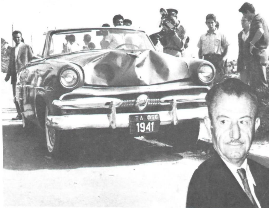
Το αυτοκίνητο της ξένης αποστολής με το οποίο οι Αμερικάνοι «προστάτες» δολοφόνησαν τον Στρατηγό Στέφανο Σαράφη στις 31 Μάη 1957.