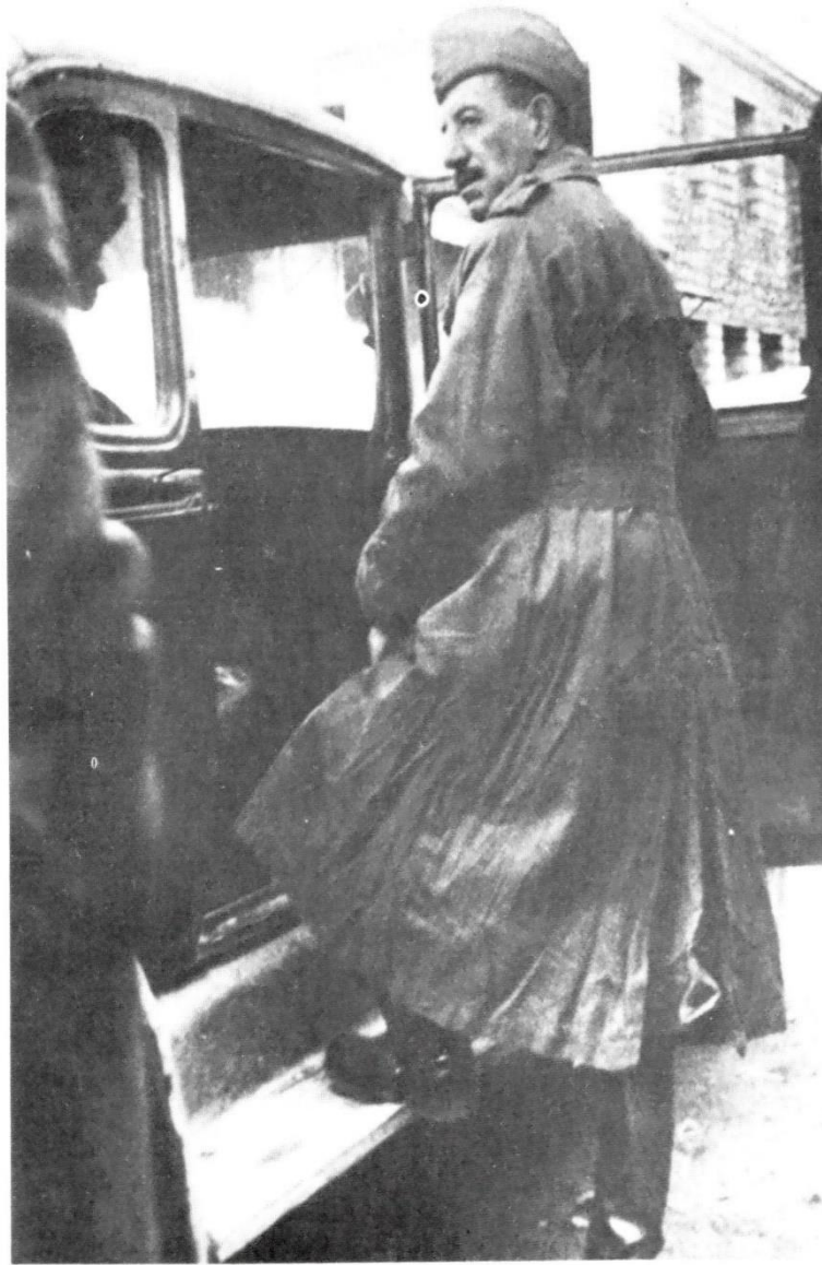
Στρατηγός Στέφανος Σαράφης