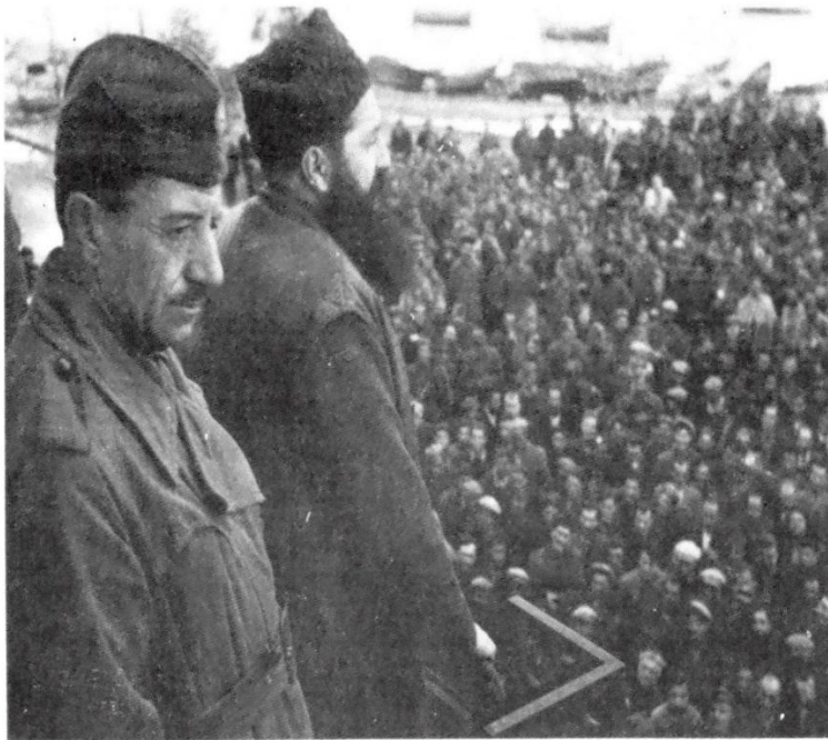
Ο Σαράφης και ο Άρης Βελουχιώτης σε λόγο στους στο Αργίριο