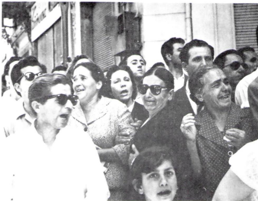
Ο σπαραγμός και η οδύνη του λαού στο άκουσμα του θανάτου του Στρατηγού