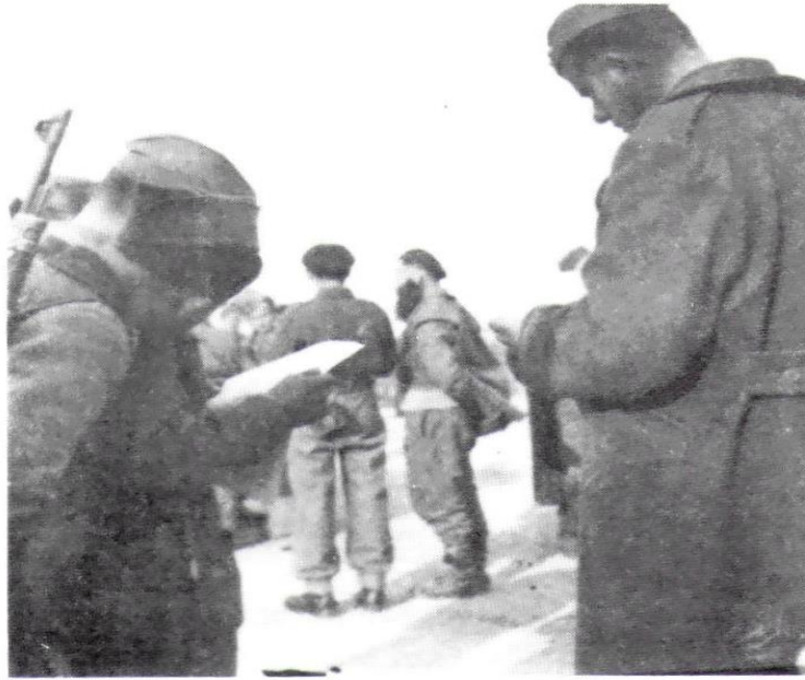
Στιγμιότυπο από την παράδοση των όπλων.