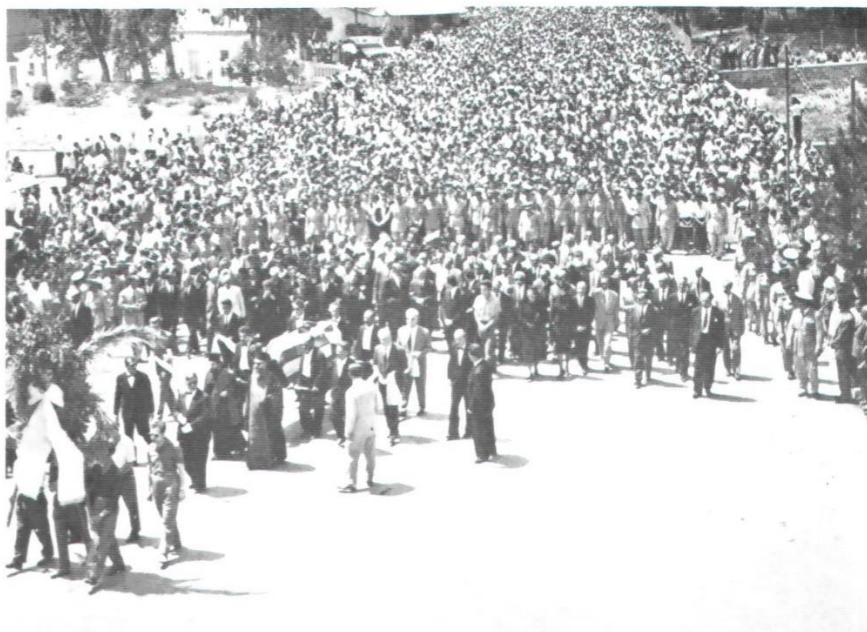
Το πλήθος ανεβαίνει την Αναπαύσεως.