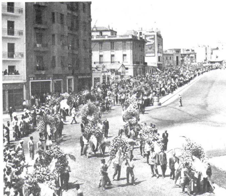
Εκατοντάδες στεφάνια στην Αμαλία μπροστά από το φέρετρο κατευθύνονται προς το νεκροταφείο.