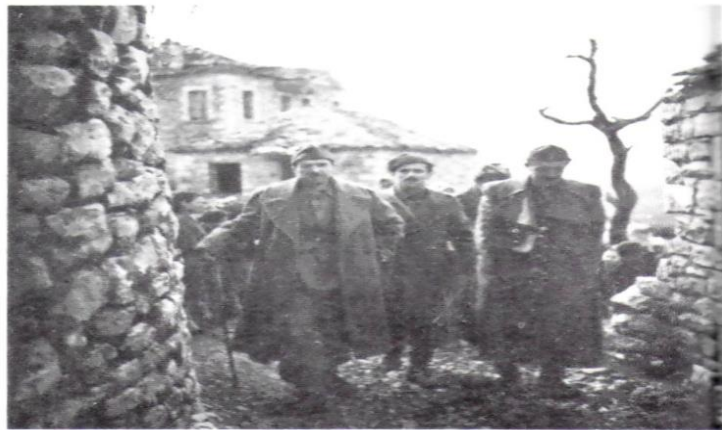
Ο Σαράφης με τον Γενικό Γραμματέα του ΚΚΕ. Γ. Σιάντο Στο Γενικό Στρατηγείο του ΕΛΑΣ (Περτούλι Τρικάλων).