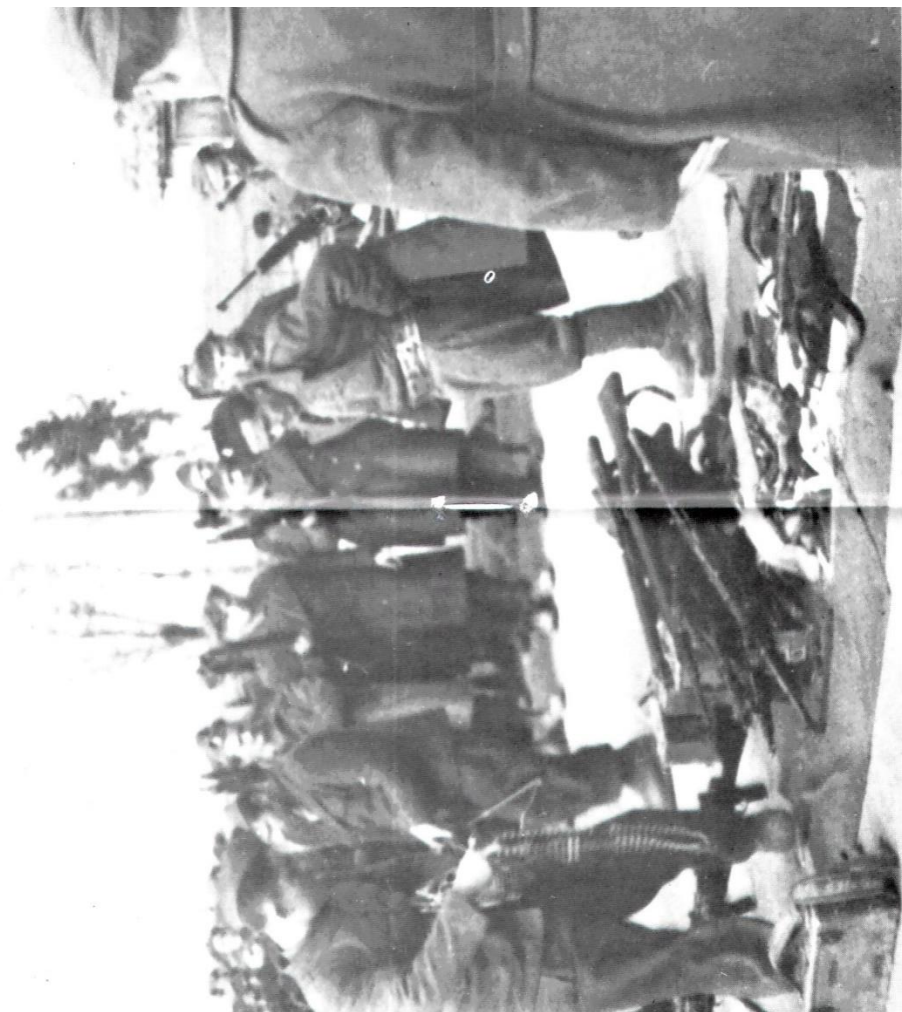
Σπάνια φωτογραφία από την παράδοση των όπλων.