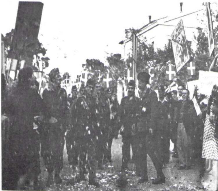
Από την είσοδο στην Αθήνα μετά την απελευθέρωση. Τον ραίνουν με λουλούδια στην περιοχή της Ερυθραίας.