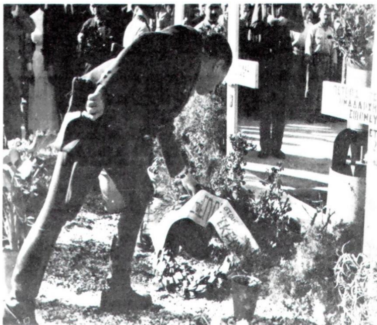
Ο αρχηγός του ΕΛΑΣ καταθέτει στεφάνια στους τάφους των εφεδροελασιτών που έπεσαν στα γεγονότα του Δεκέμβρη.