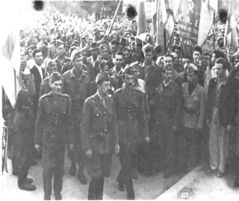
Ο Σαράφης στο Χαλάνδρι τον καιρό της απελευθέρωσης