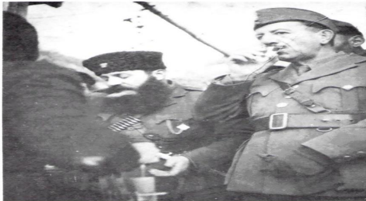
Ο Σαράφης με τον Άρη Βελουχιώτη