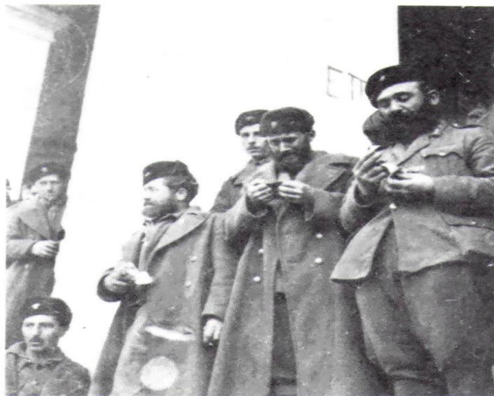
Στιγμιότυπο από την παράδοση των όπλων.