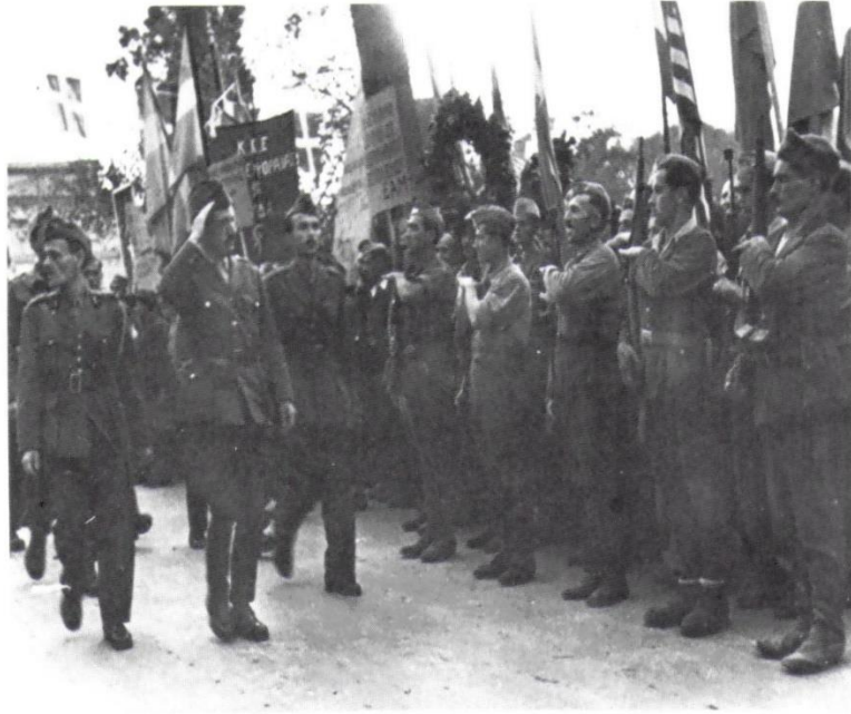
Στιγμές από την απελευθέρωση. Επιθεώρηση στρατιωτικού τμήματος του Εφεδρικού ΕΛΑΣ.