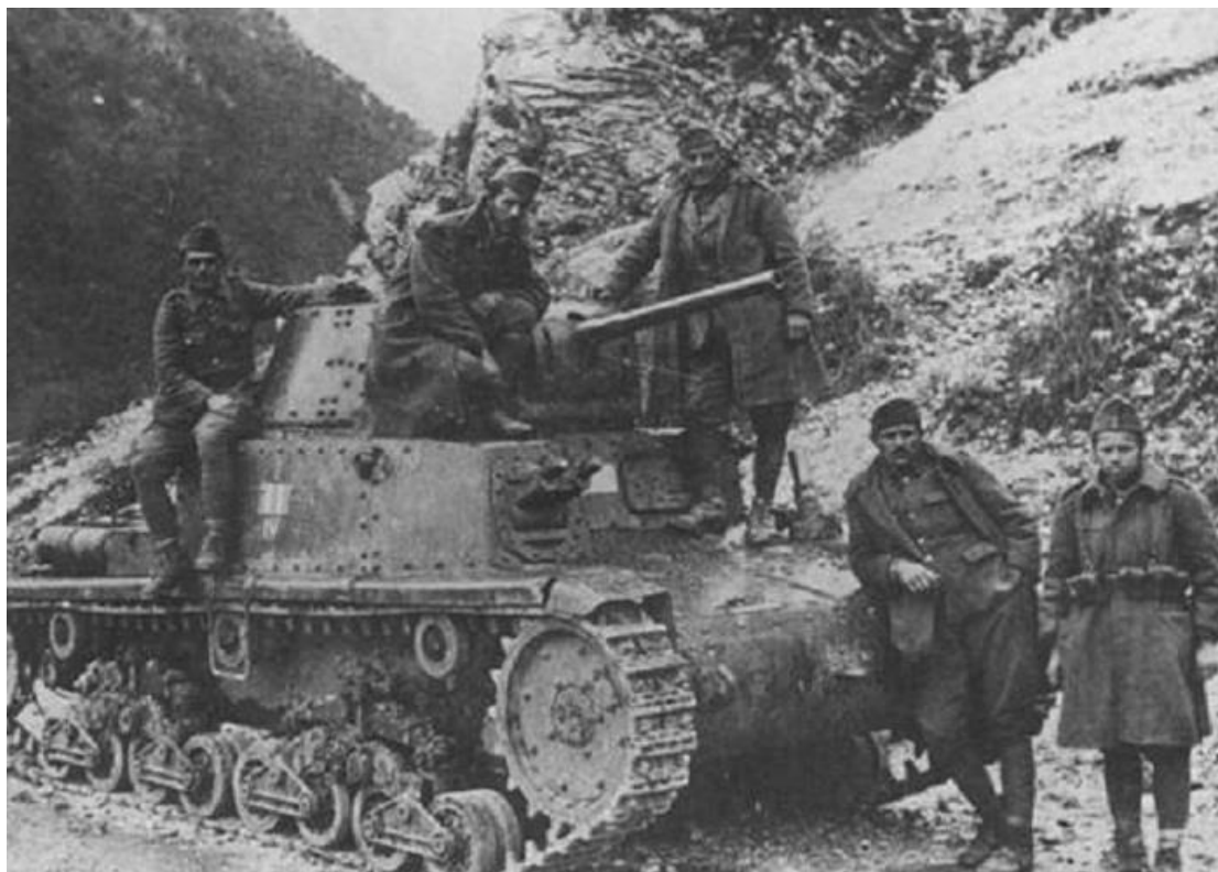
Έλληνες στρατιώτες με κυριευμένο ιταλικό άρμα M13/40 Διαθέσιμο στο: https://www.history-point.gr/1940-o-moysolini-exoplizei-ton-elliniko-strato-me-opla-ek-lafyron ημερομηνία προσπέλασης 28.7.2022