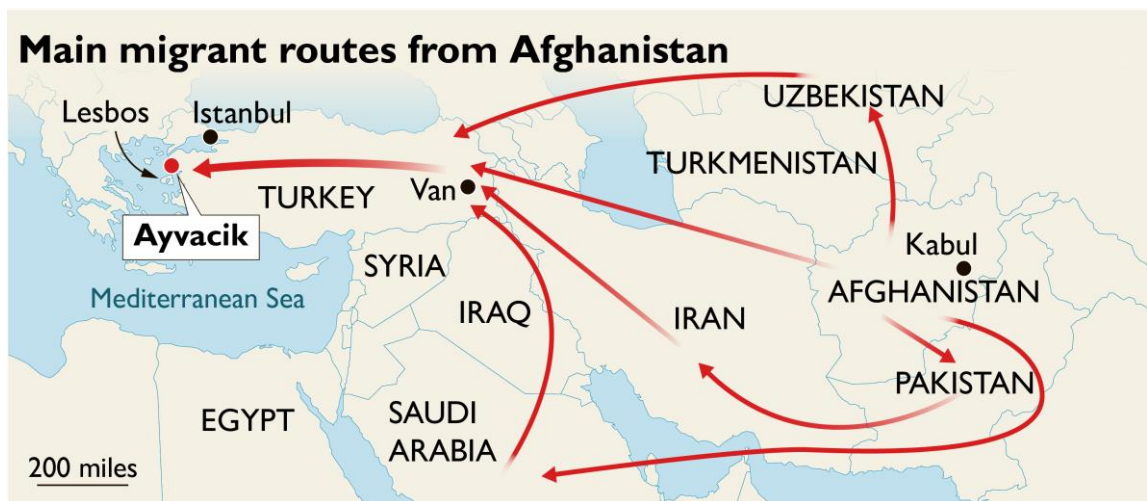
Εικόνα 1. Afghans on the March to Europe as Taliban advance (The Times, 2021)

Παρατηρώντας σε βάθος περίοδο τριετίας και πιο συγκεκριμένα από τα στοιχεία των ετών 2018, 2019 και 2020 της Υπηρεσίας Υποδοχής και Ταυτοποίησης του Υπουργείου Μετανάστευσης και Ασύλου, τις προαναφερόμενες χώρες στη λίστα κατάταξης και επιλέγω με βάση τα κριτήρια που έχουν προαναφερθεί ως πρώτη χώρα παρατήρησης το Αφγανιστάν, ως δεύτερη τη Σομαλία και ως τρίτη το Νεπάλ.