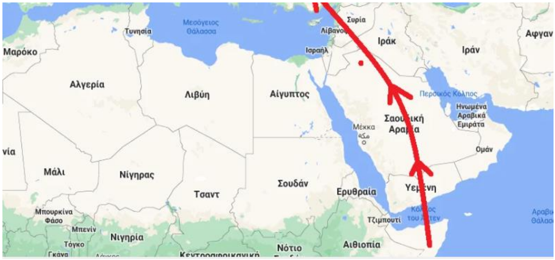
Εικόνα 2. Από τη Σομαλία στο Ανατολικό Αιγαίο

από ακραία ξηρασία. Αυτό προκάλεσε επίσης τη μείωση των αποθεμάτων τροφίμων, με αποτέλεσμα την εκτεταμένη φτώχεια, την πείνα και τις πολιτικές αναταραχές (Chan, 2020).