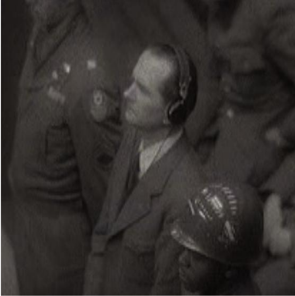
ΦΩΤ7: Hubert_Lanz_1948, National Archives and Records Administration, 111 ADC 7311 USHMM File Num 3751, ανακτήθηκε την Παρασκευή, 16/12/2022