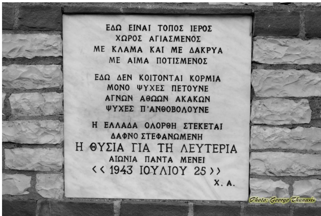
ΦΩΤ9: Αναθηματική Πλάκα

ΕΔΩ ΕΙΝΑΙ ΤΟΠΟΣ ΙΕΡΟΣ ΧΩΡΟΣ ΑΓΙΑΣΜΕΝΟΣ ΜΕ ΚΛΑΜΑ ΚΑΙ ΜΕ ΔΑΚΡΥΑ ΜΕ ΑΙΜΑ ΠΟΤΙΣΜΕΝΟΣ ΕΔΩ ΔΕΝ ΚΟΙΤΟΝΤΑΙ ΚΟΡΜΙΑ ΜΟΝΟ ΨΥΧΕΣ ΠΕΤΟΥΝΕ ΑΓΝΩΝ ΑΘΩΩΝ ΑΚΑΚΩΝ ΨΥΧΕΣ Π'ΑΝΘΟΒΟΛΟΥΝΕ Η ΕΛΛΑΔΑ ΟΛΟΡΘΗ ΣΤΕΚΕΤΑΙ ΔΑΦΝΟ ΣΤΕΦΑΝΩΜΕΝΗ Η ΘΥΣΙΑ ΓΙΑ ΤΗ ΛΕΥΤΕΡΙΑ ΑΙΩΝΙΑ ΠΑΝΤΑ ΜΕΝΕΙ << 1943 ΙΟΥΛΙΟΥ 25 >> Χ. Α.