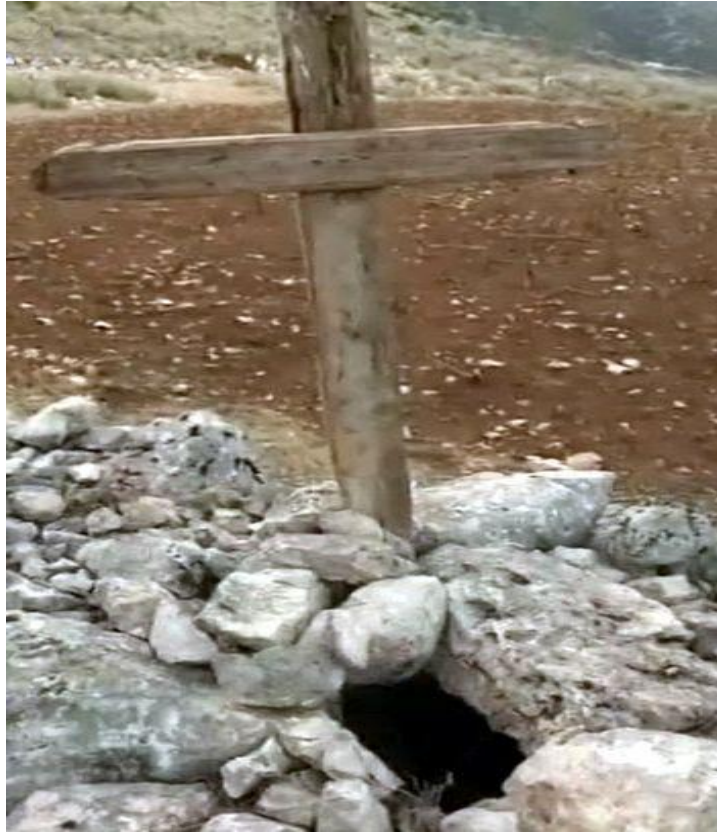
ΦΩΤ16: Μουσιωτίτσα, ο προσωρινός τάφος στο Σπιθάρι, οικογενειακή φωτογραφία