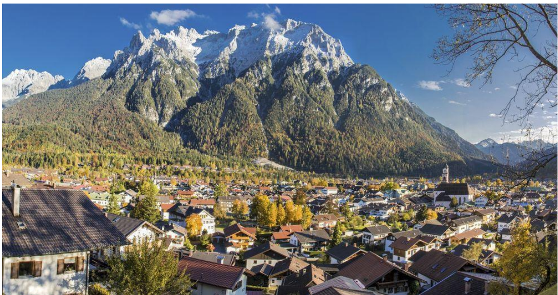
ΦΩΤ17: Mittenwald, ανακτήθηκε από το διαδίκτυο, Παρασκευή 16/12/2022