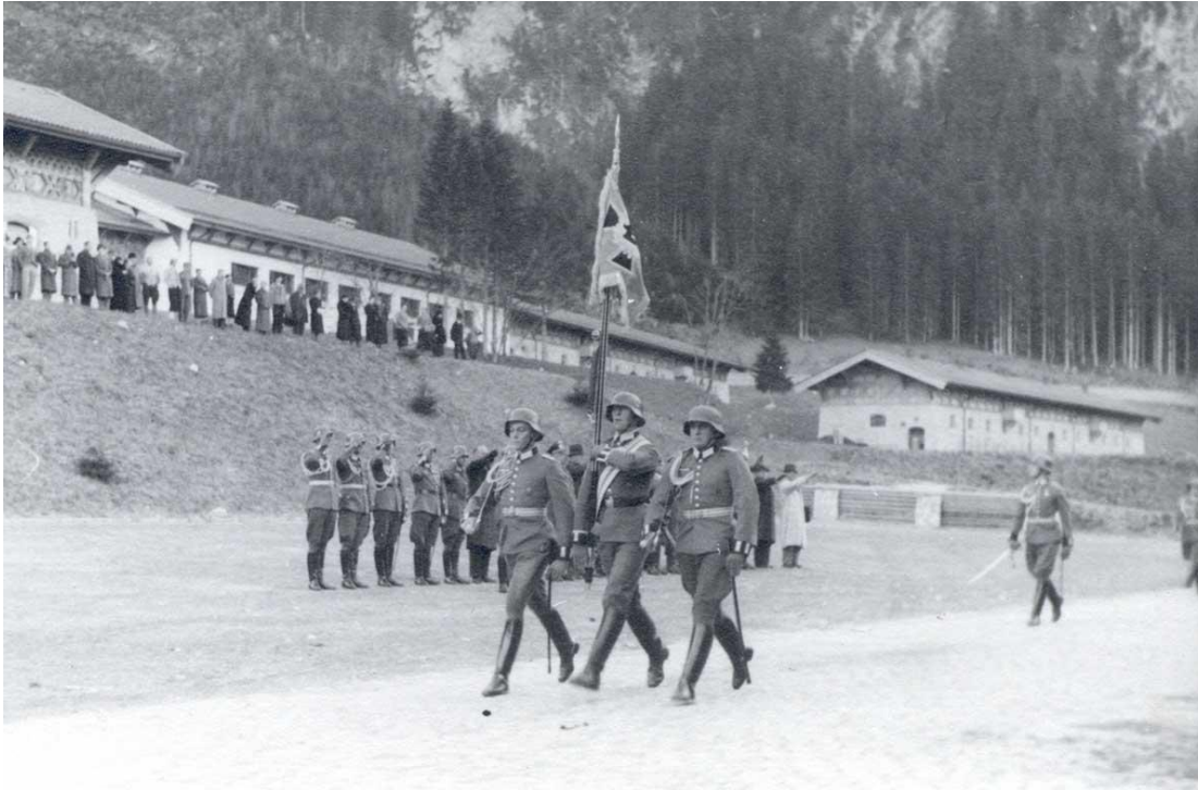
ΦΩΤ14 : Mittenwald, το στρατόπεδο των Ορεινών Καταδρομέων, ανακτήθηκε την Παρασκευή, 16/12/2002, από το διαδίκτυο