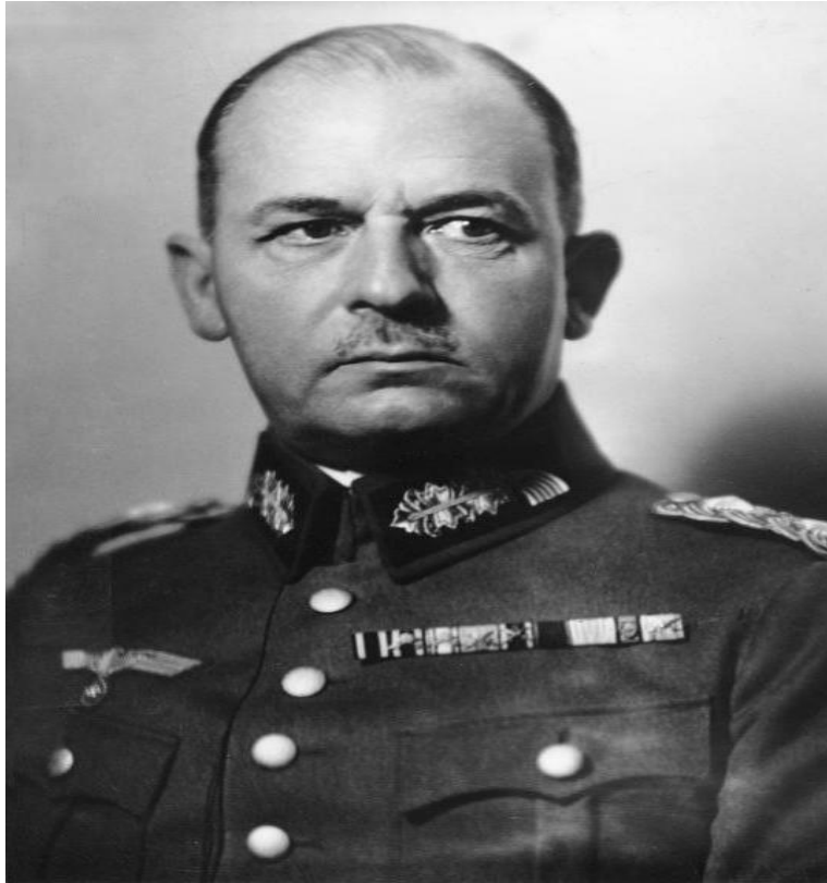
ΦΩΤ8: Bundesarchiv_Bild_183-S36487,_Wilhelm_List, ανακτήθηκε την Παρασκευή, 16/12/2022