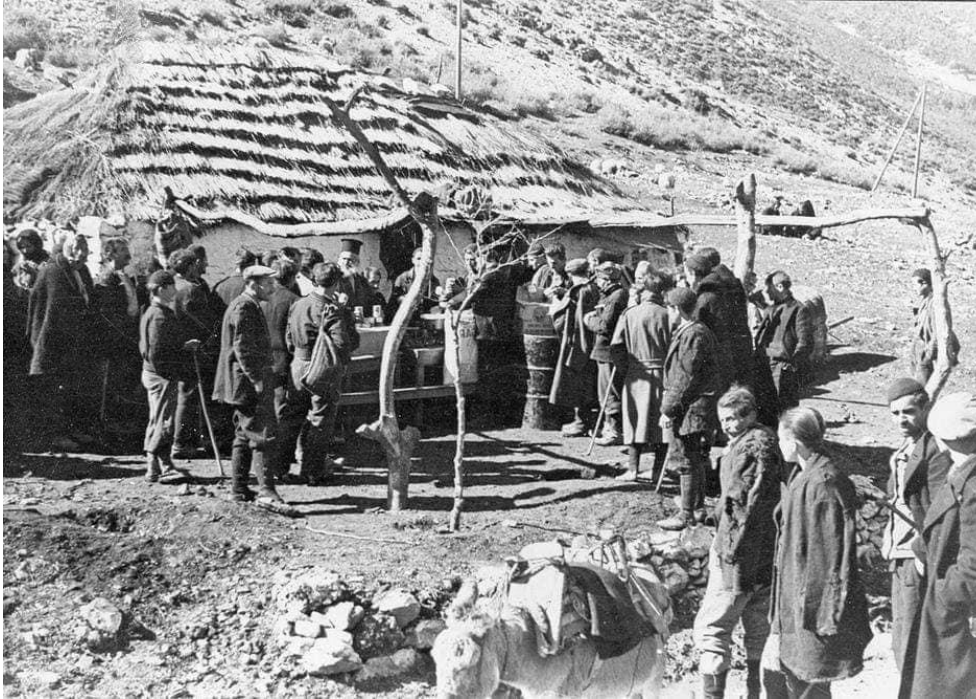
ΦΩΤ1: Διανομή τροφίμων, UNRRA 2