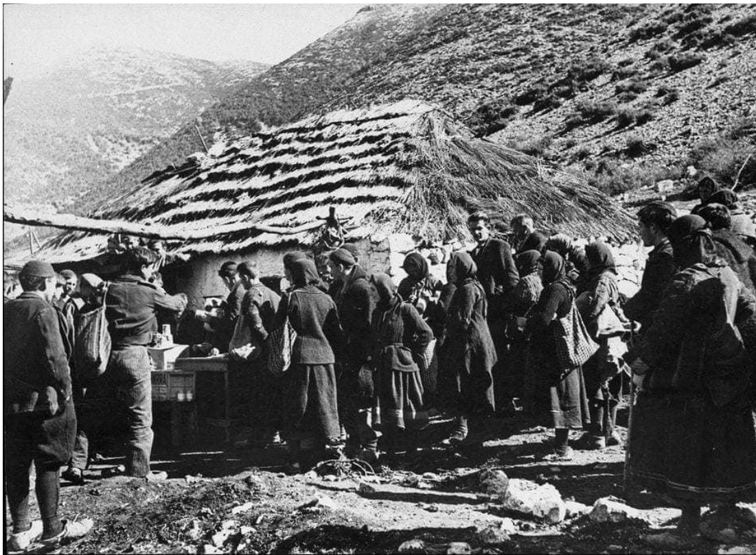
ΦΩΤ4: Διανομή τροφίμων, UNNRA. Οικογενειακό αρχείο