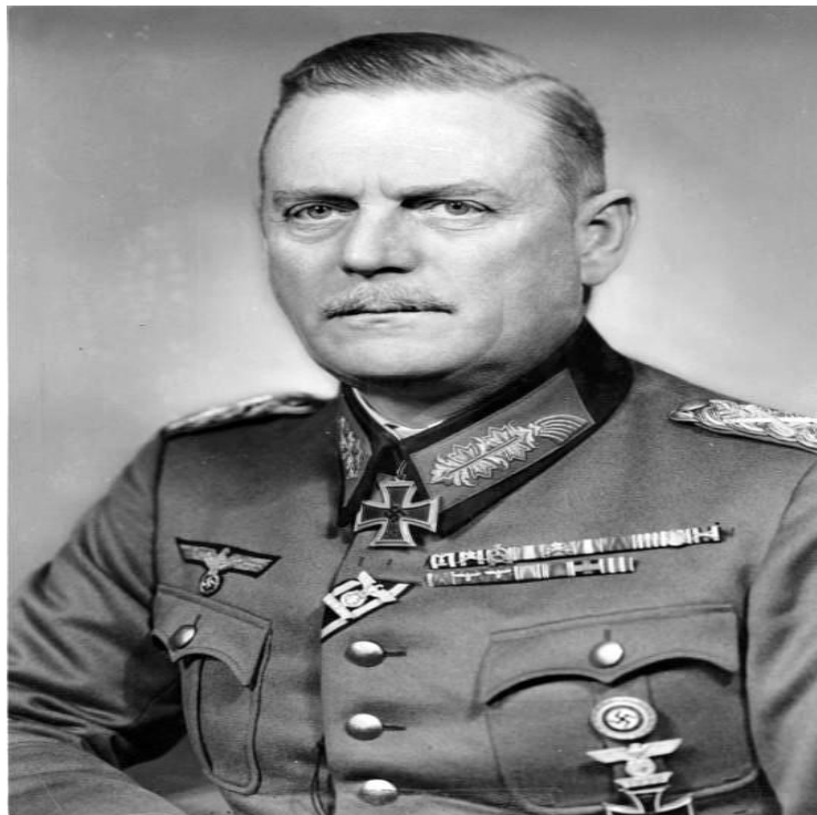
ΦΩΤ11: Bundesarchiv_Bild_183- H30220,_Wilhelm_Keitel, ανακτήθηκε την Παρασκευή, 16/12/2022