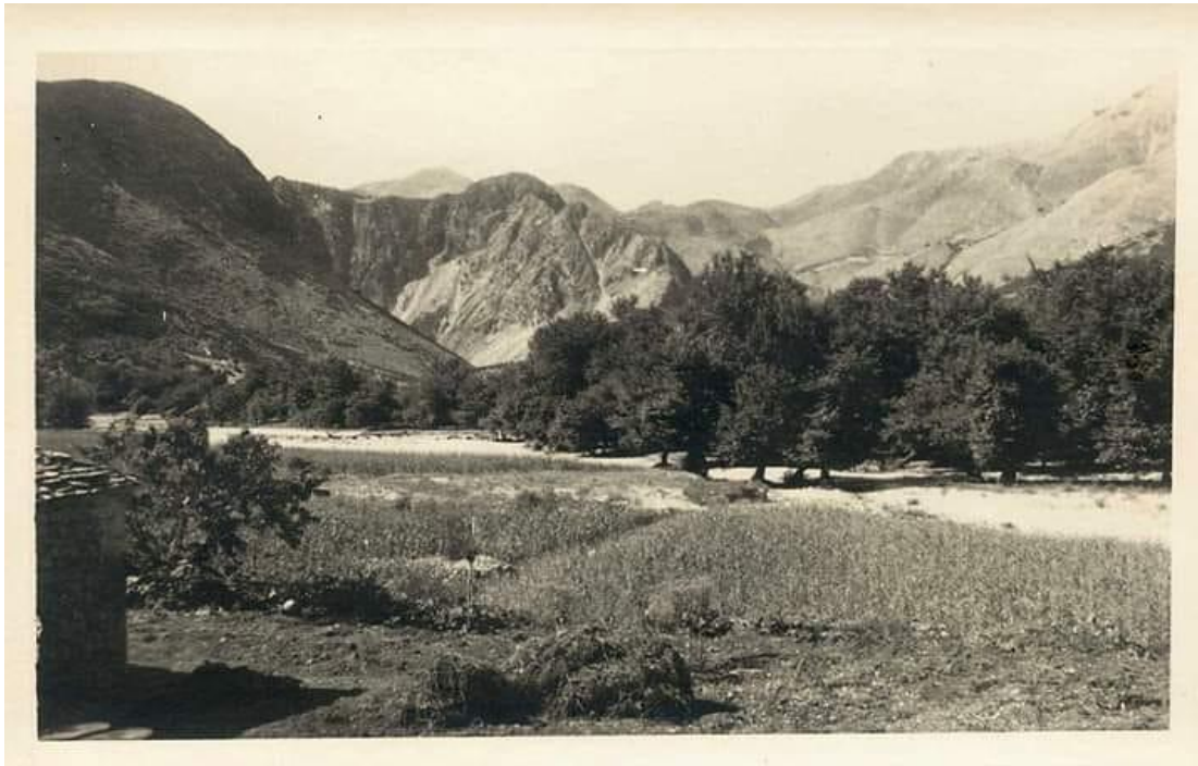
ΦΩΤ8: Ποταμός Λούρος με τα πλατάνια του, οικογενειακή φωτογραφία