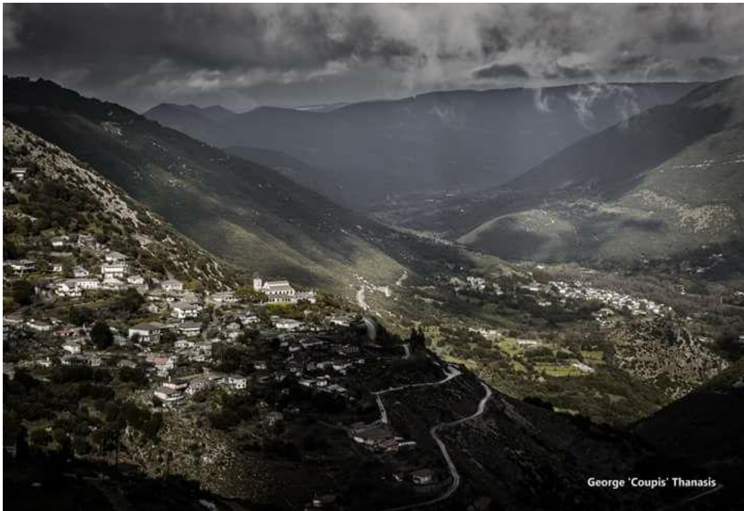
ΦΩΤ20: Μουσιωτίτσα, η λήψη από το Σπιθάρι