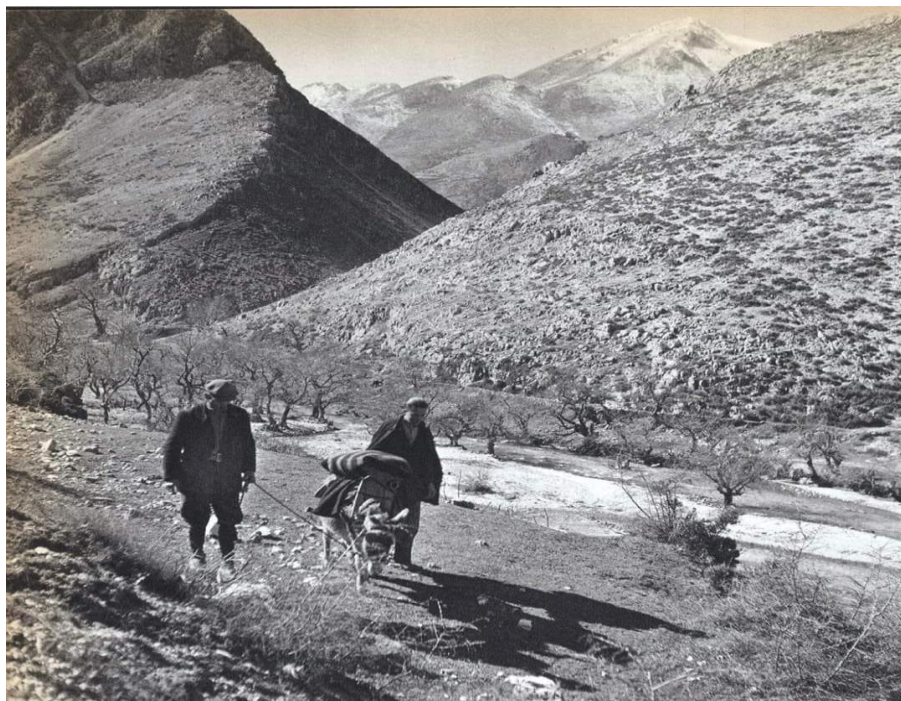
ΦΩΤ21: Μουσιωτίτσα στο βάθος πάνω στο λόφο, οικογενειακή φωτογραφία