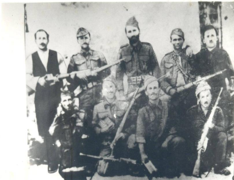
ΦΩΤ2: Λόχος του Ελεύθερου 1ου Συντάγματος Σουλίου ΕΔΕΣ. Ο παππούς δεύτερος από αριστερά κάτω και γύρω αδέρφια και διάφοροι συγγενείς και φίλοι.