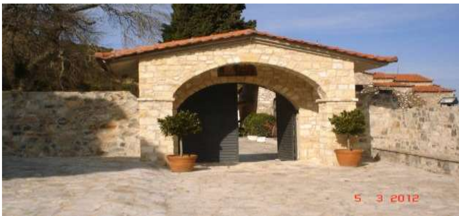
Ναός αγίου Νικολάου στη Βοιωτία

Προσκυνηματικός ναός προς τιμήν του αγίου υπάρχει στο χωριό Βούναινα, που βρίσκεται μισή ώρα έξω από τη Λάρισα στον τόπο μαρτυρίου του αγίου Νικολάου. Ο ναός αυτός κατασκευάστηκε το 1962 στη θέση παλαιότερου (κτισθέντα το 1883) ο οποίος καταστράφηκε από φωτιά στις 22 Μαΐου του 1962. Μέσα στο ναό υπάρχει το κενοτάφιο του οσιομάρτυρα αγίου Νικολάου, τεμάχιο του Ιερού του λειψάνου καθώς και οι εικόνες της Παναγίας Βουναινιώτισσας και η θαυματουργή εικόνα του ιεράρχου αγίου Νικολάου Μύρων. Πριν τον κυρίως ναό υπάρχει ένα μικρό εκκλησάκι το οποίο είναι ο ακριβής τόπος μαρτυρίου του αγίου και το δέντρο το οποίο βασανίστηκε ο άγιος. Κάθε χρόνο στη γιορτή του αγίου ή και άλλοτε, σε κάποια από τα δέντρα φτελιάς τρέχει ένα πορφυρένιο υγρό που μοιάζει με αίμα. Στην ανατολική δε πλευρά του προσκυνημάτος, οι πιστοί που καταφθάνουν απ' όλη την Ελλάδα έχουν τη δυνατότητα να φιλοξενηθούν στους ξενώνες του κτηριακού συγκροτήματος Μονυδρίου 202 .