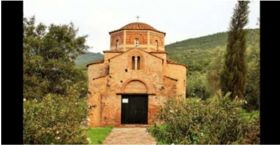
Άγιος Νικόλαος στον Έξαρχο Φθιώτιδας

Ο ναός του αγίου Νικολάου στον Έξαρχο Λοκρίδος Φθιώτιδας χρονολογείται τον 13 ο αιώνα. Ανήκει στον αρχιτεκτονικό τύπο του σταυροειδούς εγγεγραμμένου ναού με τρούλο και αποτελεί ένα εντυπωσιακό δείγμα αρχιτεκτονικής. Ο τρούλος είναι οκταγωνικός με τέσσερα μονόλοβα παράθυρα και κεραμοπλαστικό διάκοσμο. Ο νάρθηκας είναι νεωτέρα προσθήκη και η κόγχη του ιερού είναι τρίπλευρη με μεγάλο δίλοβο παράθυρο. Ο ναός είναι κτισμένος από δόμους και ογκόλιθους οι οποίοι προέρχονται από αρχαιότερο κτίσμα 211 .