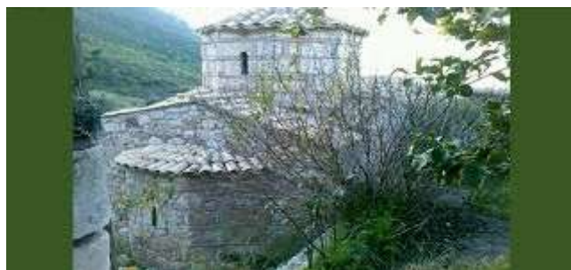
Μονή Αγίου Νικολάου Μαλαγαρίου