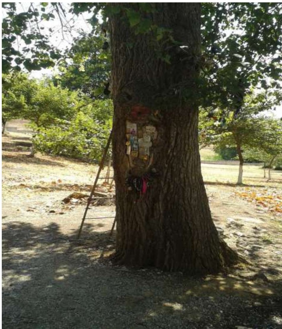
Το δέντρο στο οποίο μαρτύρησε ο άγιος

Κατά την ετήσια μνήμη του οσιομάρτυρα παρατηρείται ένα εντυπωσιακό γεγονός στον τόπο του μαρτυρίου του. Από τα δέντρα φτελιάς, στα οποία βασανίστηκαν οι συνασκητές του ρέει ένα κόκκινο υγρό το οποίο μοιάζει με αίμα και πλημμυρίζει τη ρίζα ενός κομμένου δέντρου στο οποίο βασανίστηκε ο άγιος. Πιστοί από όλη την Ελλάδα συρρέουν στον τόπο του μαρτυρίου και αποθηκεύουν σε φιαλίδια το υγρό αυτό, το οποίο όταν χρησιμοποιείται με πίστη και εμπιστοσύνη στον οσιομάρτυρα έχει θεραπευτικές ιδιότητες ιδιαίτερα σε δερματικές παθήσεις και κεφαλαλγίες.