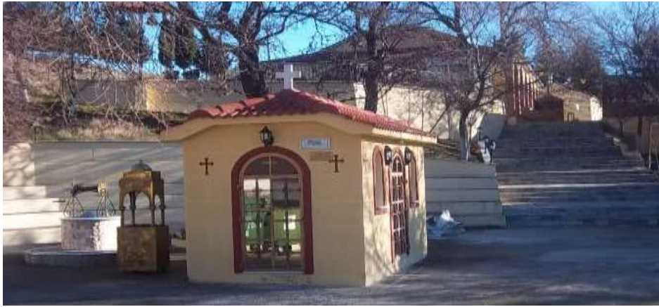
Ναός Αγίου Νικολάου στα Βούναινα

Προσκυνηματικός ναός προς τιμήν του αγίου υπάρχει στο χωριό Βούναινα, που βρίσκεται μισή ώρα έξω από τη Λάρισα στον τόπο μαρτυρίου του αγίου Νικολάου. Ο ναός αυτός κατασκευάστηκε το 1962 στη θέση παλαιότερου (κτισθέντα το 1883) ο οποίος καταστράφηκε από φωτιά στις 22 Μαΐου του 1962. Μέσα στο ναό υπάρχει το κενοτάφιο του οσιομάρτυρα αγίου Νικολάου, τεμάχιο του Ιερού του λειψάνου καθώς και οι εικόνες της Παναγίας Βουναινιώτισσας και η θαυματουργή εικόνα του ιεράρχου αγίου Νικολάου Μύρων. Πριν τον κυρίως ναό υπάρχει ένα μικρό εκκλησάκι το οποίο είναι ο ακριβής τόπος μαρτυρίου του αγίου και το δέντρο το οποίο βασανίστηκε ο άγιος. Κάθε χρόνο στη γιορτή του αγίου ή και άλλοτε, σε κάποια από τα δέντρα φτελιάς τρέχει ένα πορφυρένιο υγρό που μοιάζει με αίμα. Στην ανατολική δε πλευρά του προσκυνημάτος, οι πιστοί που καταφθάνουν απ' όλη την Ελλάδα έχουν τη δυνατότητα να φιλοξενηθούν στους ξενώνες του κτηριακού συγκροτήματος Μονυδρίου 202 .