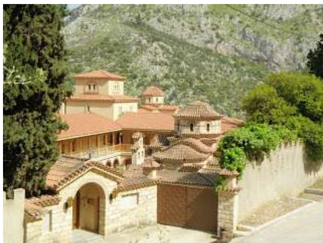
Ιερά Μονή Αγίου Νικολάου Μαψού

αγίου Νικολάου του Νέου και του αγίου Νικολάου του Θαυματουργού, του προστάτη των ορφανών. Η ακριβής ημερομηνία ίδρυσης της μονής δεν είναι γνωστή αλλά τοποθετείται χρονολογικά γύρω στον 10 ο αιώνα μ.Χ.. Η μονή έχει καεί και ξαναχτιστεί από την αρχή τρεις φορές. Το Καθολικό της μονής είναι κατασκευασμένο σύμφωνα με τον αρχιτεκτονικό τύπο της βασιλικής με τρούλο ενώ δίπλα από το ναό υπάρχει παρεκκλήσι της Γέννησης της Θεοτόκου. Στο σκευοφυλάκιο της μονής φυλάσσονται Ιερά λείψανα, πολύτιμα ευαγγέλια, βυζαντινές εικόνες, ιερά κειμήλια καθώς και το παλιό ξυλόγλυπτο τέμπλο του καθολικού της μονής 205 .