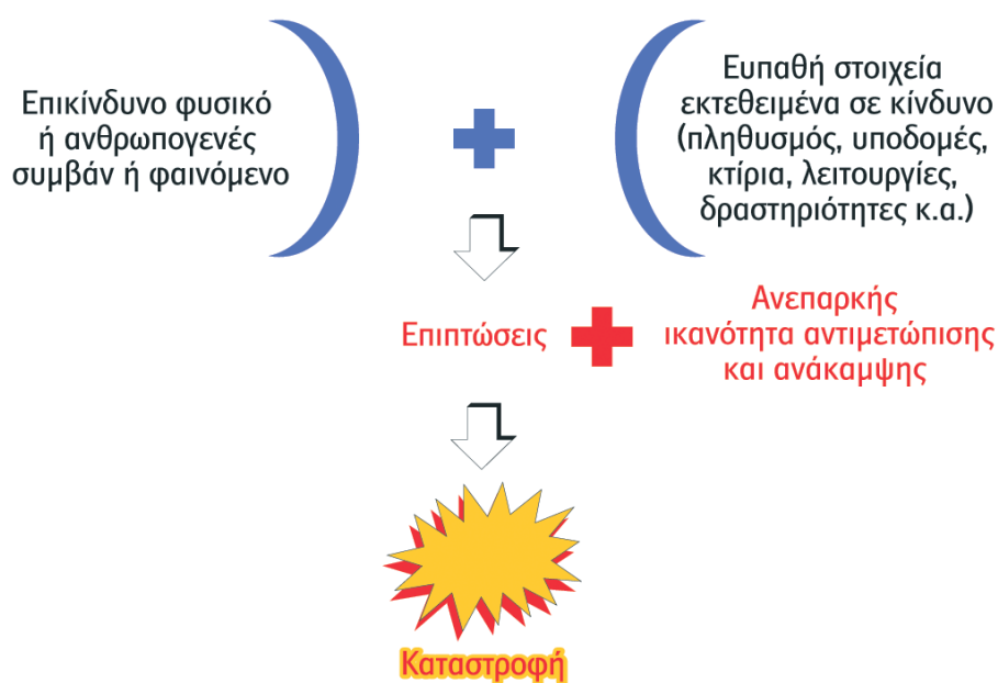
Εικόνα 1: Βασικές συνιστώσες για την πρόκληση μιας καταστροφής

ευπάθειας και τρωτότητας στην κοινωνία και αποδεικνύεται ανεπαρκής η ικανότητα της κοινωνίας να μετριάσει τις ενδεχόμενες επιπτώσεις και να ανακάμψει από αυτές (Εικόνα 1).