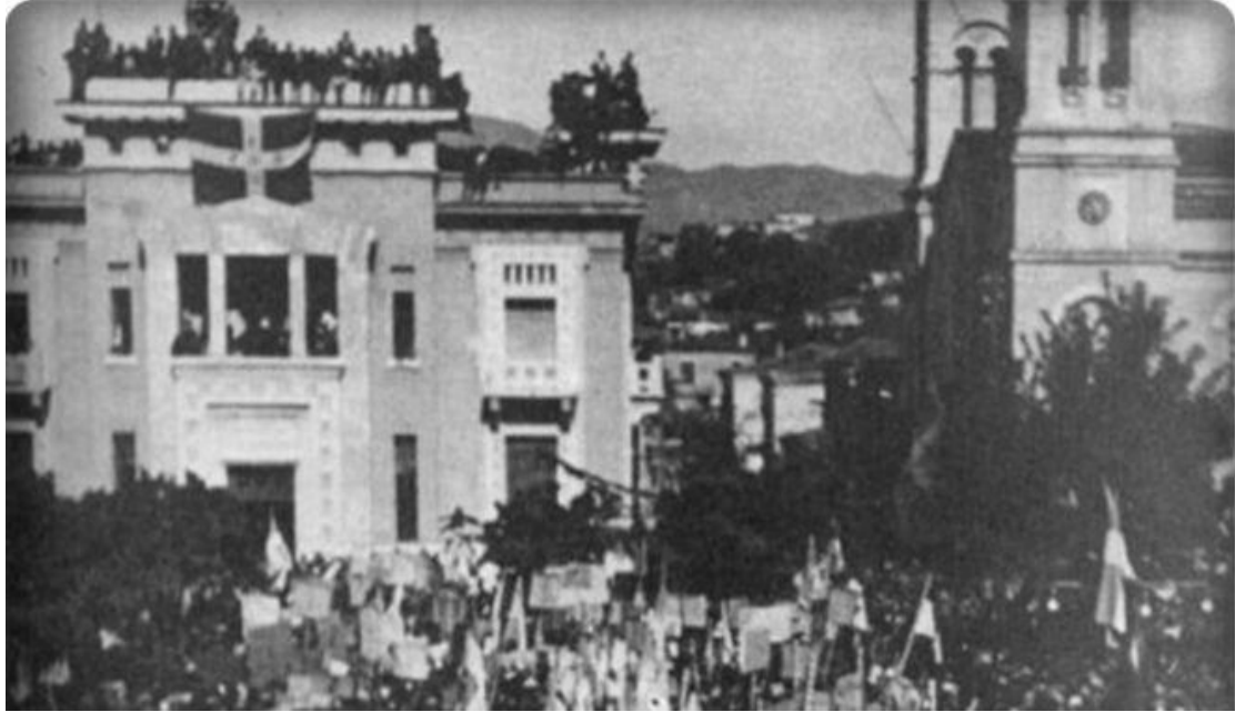
Η απελευθέρωση της Λαμίας, 18 Οκτωβρίου 1944.

Το κτήριο της Εθνικής Τράπεζας (πρώην Νομαρχία) την περίοδο της Κατοχής.