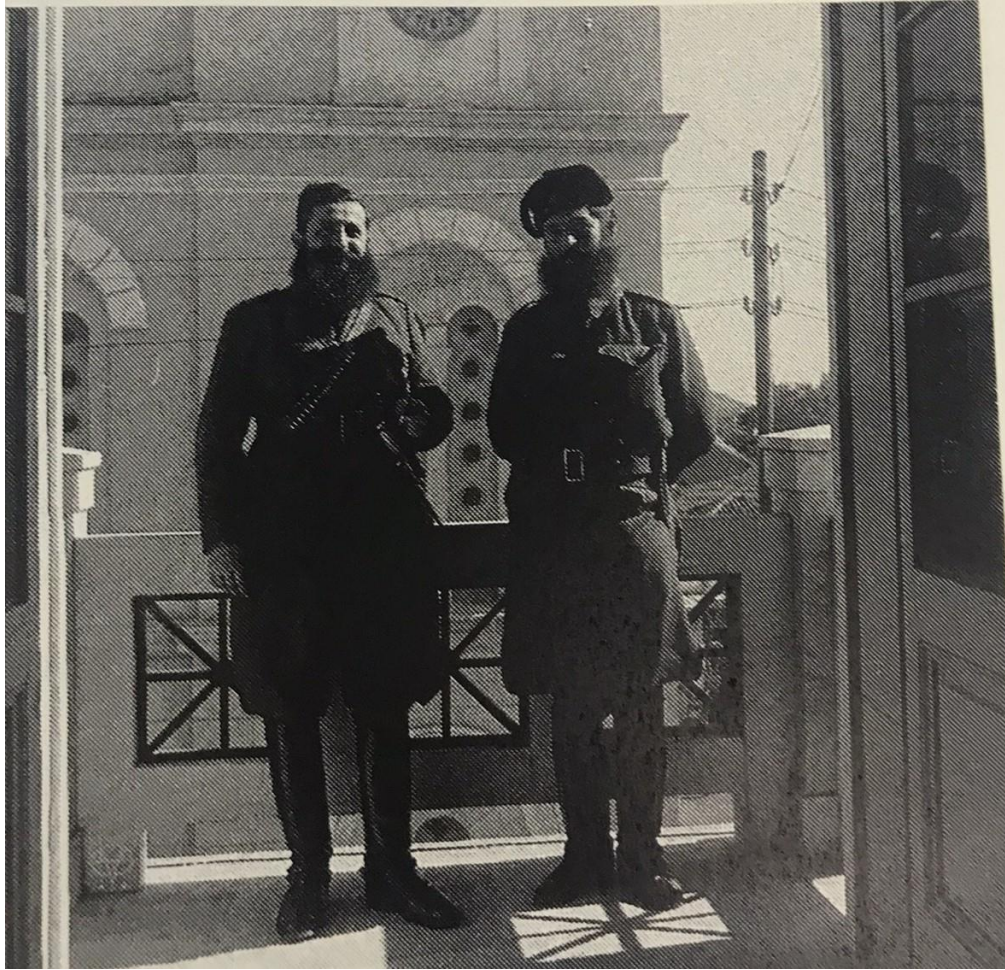
Ο Άρης Βελουχιώτης με το σωματοφύλακά του, Κωστούλα.