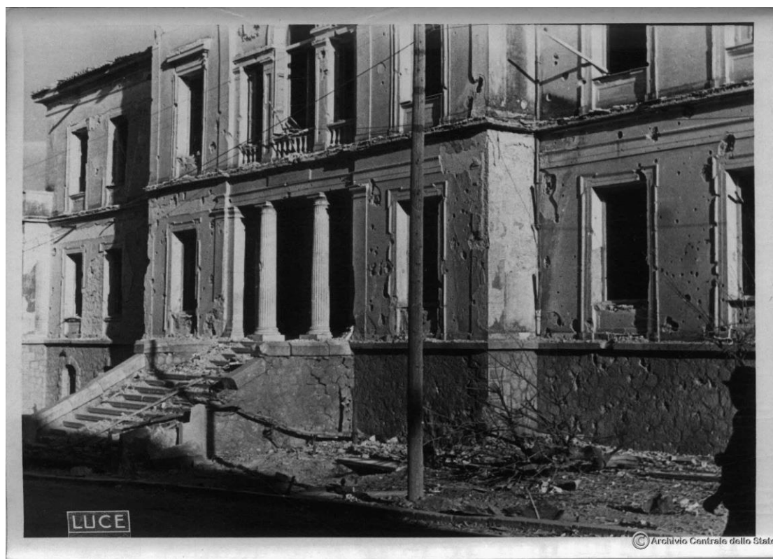
Τοπική διαταγή του Ιταλικού Φρουραρχείου Λαμίας.