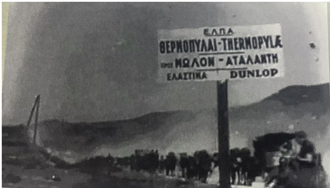
Θερμοπύλες. Γερμανικά στρατεύματα σε πορεία προς Αθήνα.